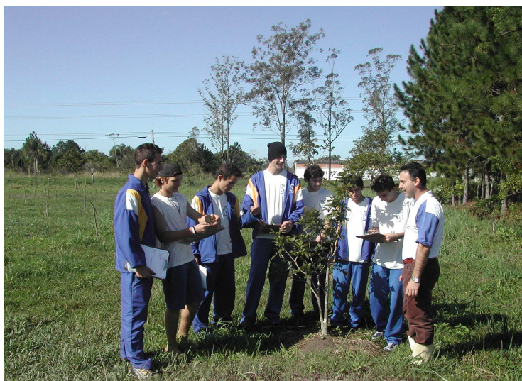
Figura 04: Área de Reflorestamento com Espécies Nativas