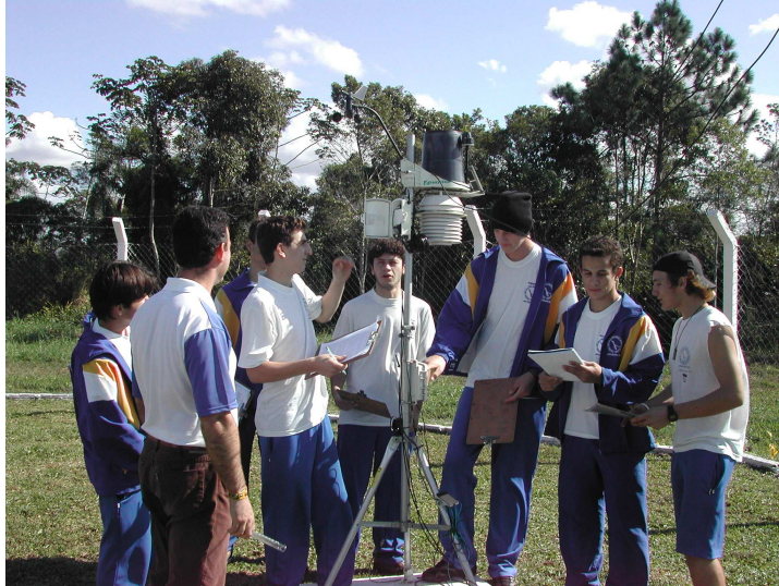
Figura 07: Aulas práticas

Em 2007, iniciamos uma atividade em conjunto com os professores de Culturas anuais, Solos, Gestão e Planejamento e Projeto. Nesta atividade foram cultivadas três variedades de soja na área em redor da estação meteorológica (figura 08). Nosso propósito maior, foi acompanhar o desenvolvimento da cultura em diferentes condições de adubação e das condições meteorológicas, coletadas na estação meteorológica. Como complemento desta atividade, os alunos confeccionaram uma planilha de custos para demonstrar a viabilidade econômica da cultura nas diferentes condições de adubação e condições meteorológicas.