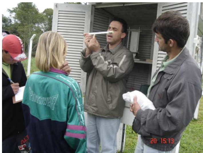
Figura 06: Alunos da Casa Familiar do Mar - São Francisco do Sul/SC