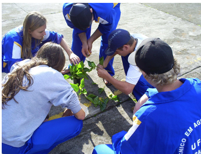
Figura 16 - Trabalho em grupo

Com a realização dos experimentos nos grupos de trabalho formados, a necessidade de interagir com os colegas foi nitidamente perceptível, fazendo com que a relação interpessoal fosse estimulada a fim de conseguirem atingir os objetivos propostos para cada um dos experimentos (Figura 16).