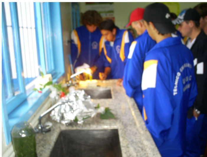
Figura 15 - Apresentação dos resultados para os grupos

No dia 01 de junho, as equipes entregaram um relatório detalhado descrevendo os experimentos, as condições em que os mesmos foram realizados, os resultados obtidos associando-os com os conceitos de Morfologia Vegetal e Climatologia Básica até então adquiridos no ano letivo.