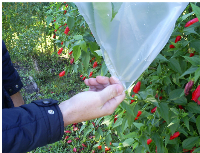
Figura 13: Experimento 2

Foram escolhidos quatro ramos de uma árvore que tem crescimento rápido, preferencialmente Hibiscus sinensis (hibisco) ou Acalypha godseffiana (Acalifa-fina). Os ramos estavam levemente inclinados para cima, ou seja, nem apontados para cima e nem para baixo. Foram colocados os sacos plásticos nos ramos escolhidos e posteriormente amarrados firmemente no caule. Dois sacos plásticos foram envolvidos com o papel alumínio de modo que eles ficaram totalmente protegidos dos raios solares. Ao colocar o saco plástico, procurou-se fazer uma pequena bolsa voltada para baixo com uma das extremidades da embalagem. Os resultados foram observados entre 1 a 3 dias. Depois deste período retirou-se o papel alumínio e comparou-se com os outros dois sacos plásticos que não estavam envolvidos com papel alumínio. Esse experimento pode ser repetido com outros tipos de plantas, áreas mais ensolaradas e menos ensolaradas, solos mais ou menos úmidos, dias mais quentes e menos quente, com mais ou menos vento, ou seja, em condições atmosféricas diferentes (Figura 13).