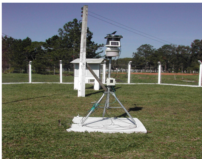
Figura 03: Estação Meteorológica Automática

Neste mesmo ano, participamos da elaboração de um Projeto que envolveu vários setores do colégio com o propósito de buscar recursos externos junto à Fundação Vitae 2 , no qual fomos contemplados com uma estação meteorológica automática (figura 03). Neste projeto também adquirimos um computador e uma impressora para podermos armazenar, manipular e divulgar os dados coletados por meio de um console que realiza a interface entre o software e a estação automática.