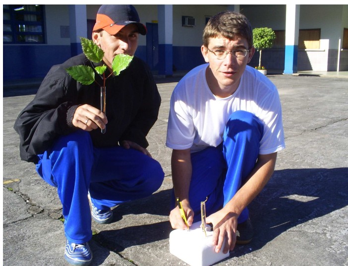
Figura 18: Ramos sendo preparados para o experimento

Os alunos usaram tubos de ensaio cheios de água e introduziram dentro deles ramos com folhas e outros sem folha, com o propósito de mostrar como a água ascende até os ramos mais altos da planta (Figura 18).