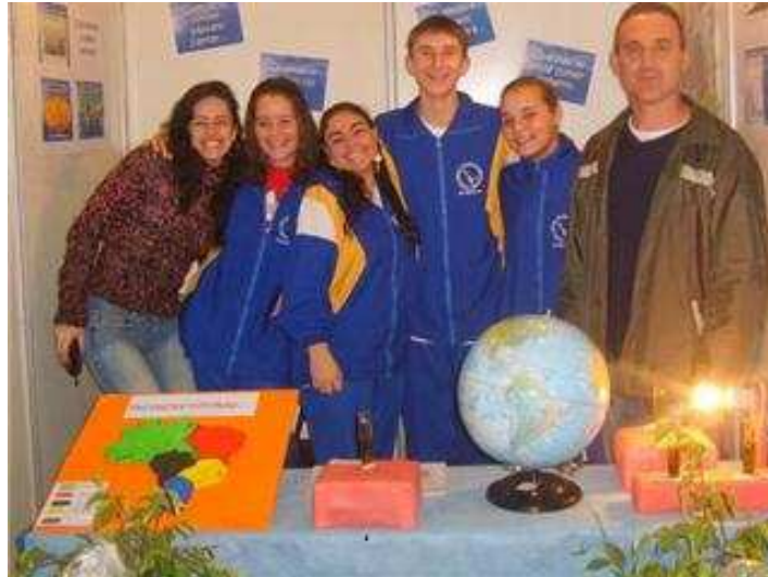
Figura 05: Mostra Científica e Tecnológica 2007