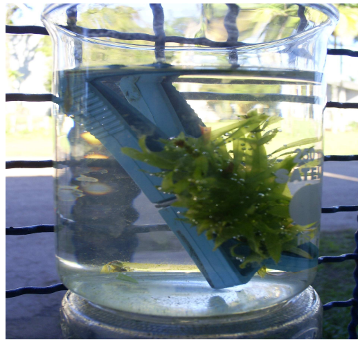
Figura 12 - Experimento 01

OBS: Repetir o experimento algumas vezes para analisar as conclusões do trabalho.