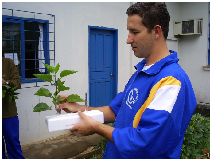
Figura 14: Experimento 3

Os dois suportes com os tubos de ensaio ficaram em locais de luminosidade e temperatura diversas para observar-se as diferentes oscilações de água dentro dos tubos em diferentes condições atmosféricas. Aproximadamente após 3 horas já foi possível observar os primeiros resultados, que foram mais perceptíveis com o passar das horas e dos dias (Figura 14).