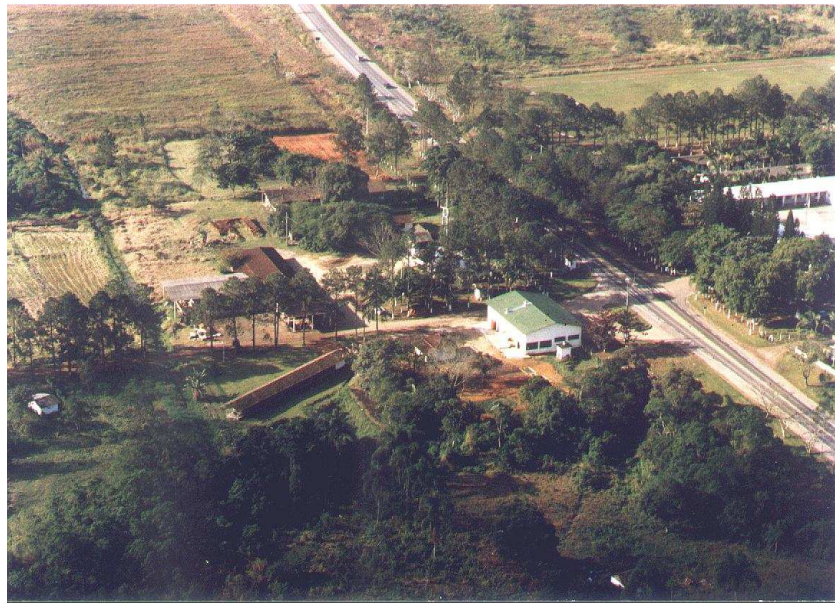
Figura 01: Foto Aérea do CASCAGO

Esta pesquisa teve como cenário o Colégio Agrícola de Araquari/SC e como sujeito os alunos do mesmo. Foi realizado com o apoio das bases tecnológicas ministradas nas disciplinas de Morfologia e Fisiologia Vegetal - MFV, Educação ambiental e Climatologia Básica. Apresentamos, a seguir, a caracterização do colégio agrícola de Araquari- SC (Figura 01), no contexto da reforma do ensino agrícola, bem como histórico da implantação da estação meteorológica do CASCAGO.