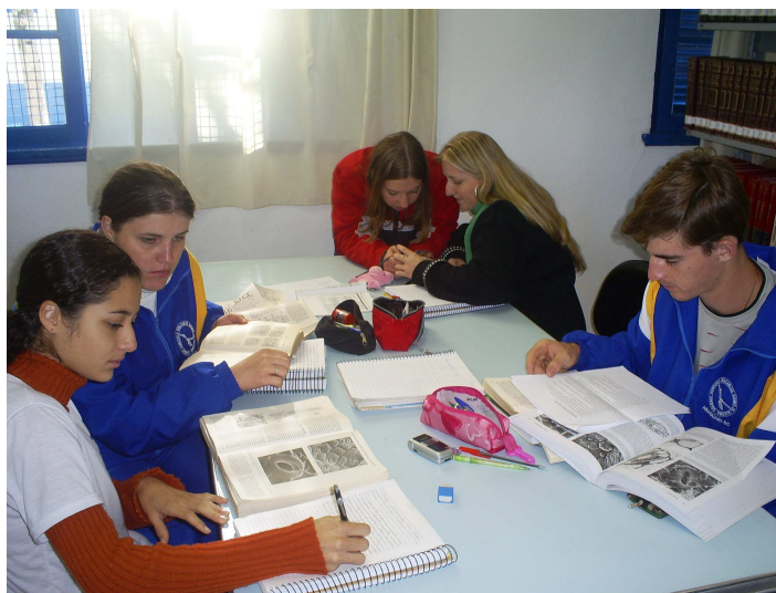
Figura 11: Pesquisa Bibliográfica

No dia 23 de maio os grupos iniciaram, após as considerações iniciais, suas atividades de pesquisa bibliográfica, de montagem de alguns experimentos e de definição dos passos que utilizariam para a execução dos trabalhos (Figura 11).