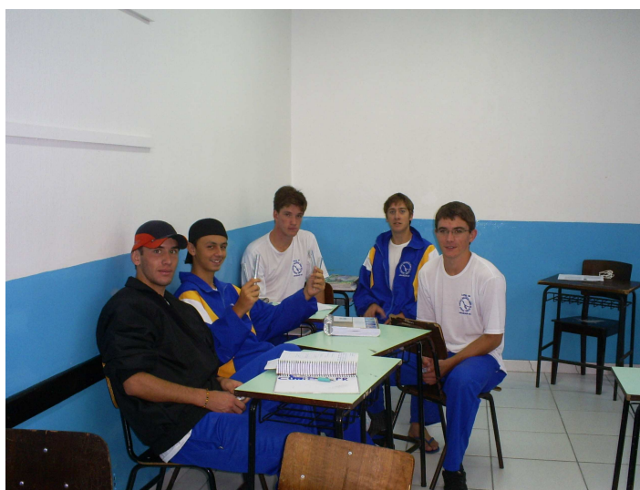
Figura 10: Distribuição dos trabalhos para os grupos

Após as explicações por grupo, reunimos todos os seis grupos e fizemos uma explicação sucinta dos trabalhos que seriam realizados por todos os grupos. A definição do experimento que cada grupo faria foi decidida por sorteio. Para cada um dos experimentos teríamos 2 grupos realizando a mesma atividade (Figura 10).