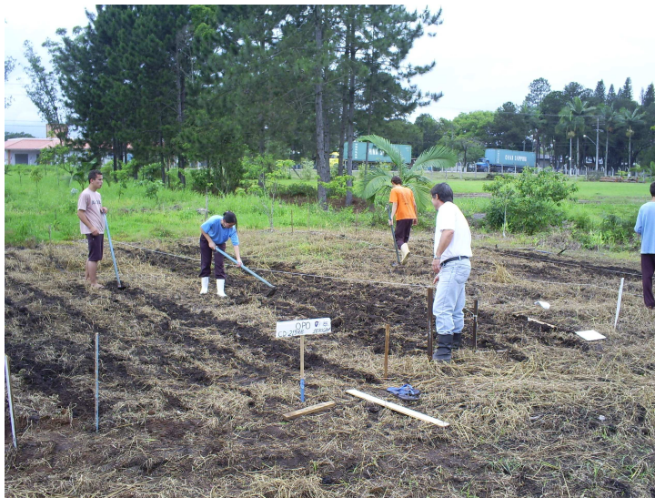
Figura 08: Área dos experimentos com a cultura da Soja

Em 2007, iniciamos uma atividade em conjunto com os professores de Culturas anuais, Solos, Gestão e Planejamento e Projeto. Nesta atividade foram cultivadas três variedades de soja na área em redor da estação meteorológica (figura 08). Nosso propósito maior, foi acompanhar o desenvolvimento da cultura em diferentes condições de adubação e das condições meteorológicas, coletadas na estação meteorológica. Como complemento desta atividade, os alunos confeccionaram uma planilha de custos para demonstrar a viabilidade econômica da cultura nas diferentes condições de adubação e condições meteorológicas.