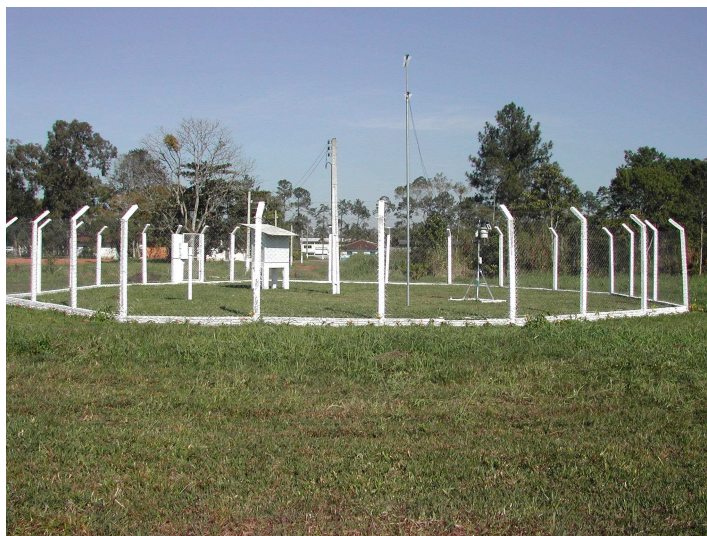
Figura 02: Estação Meteorológica do CASCGO

Neste mesmo ano, participamos da elaboração de um Projeto que envolveu vários setores do colégio com o propósito de buscar recursos externos junto à Fundação Vitae 2 , no qual fomos contemplados com uma estação meteorológica automática (figura 03). Neste projeto também adquirimos um computador e uma impressora para podermos armazenar, manipular e divulgar os dados coletados por meio de um console que realiza a interface entre o software e a estação automática.