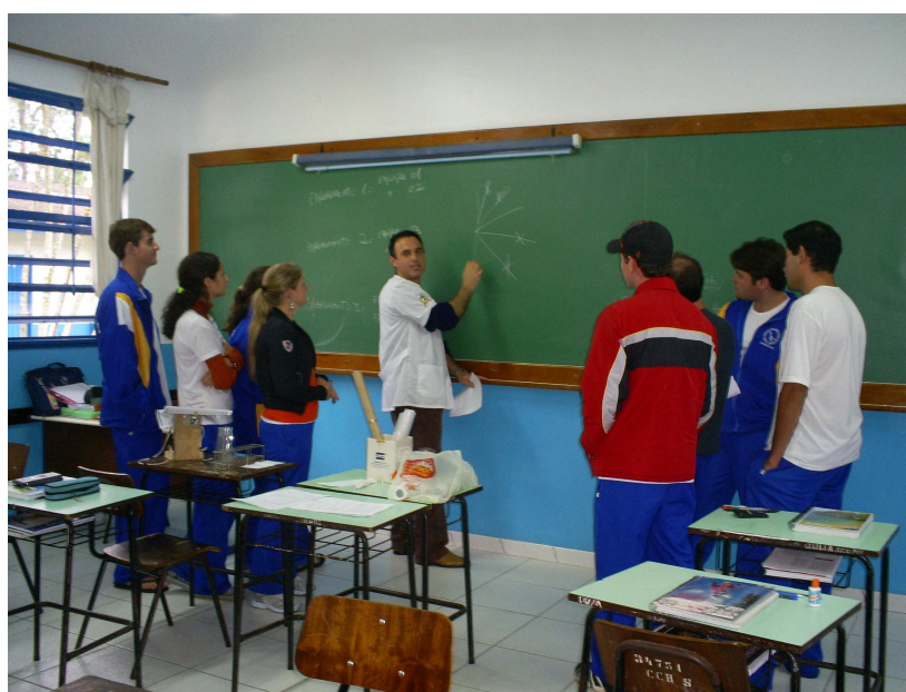
Figura 09: Distribuição dos Experimentos

Primeiramente, elaboramos um cronograma (Anexo H) a ser seguido pelas equipes explicando o objetivo de cada experimento, os materiais necessários, os procedimentos à serem seguidos e algumas questões que deveriam ser observadas e respondidas quando da apresentação dos resultados (Figura 09).