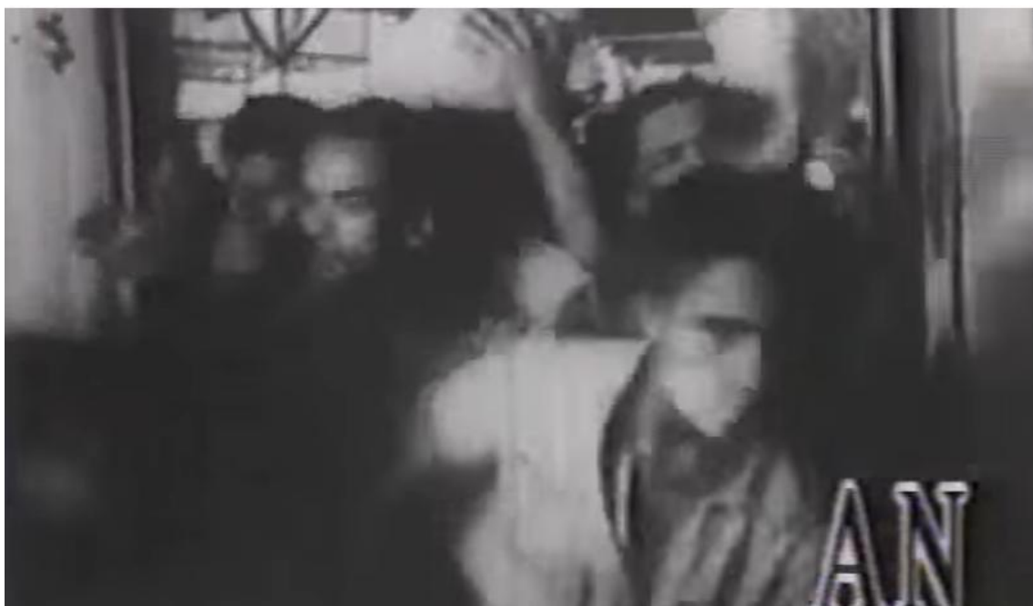
Imagem 9 — Tumulto ao sair do vagão