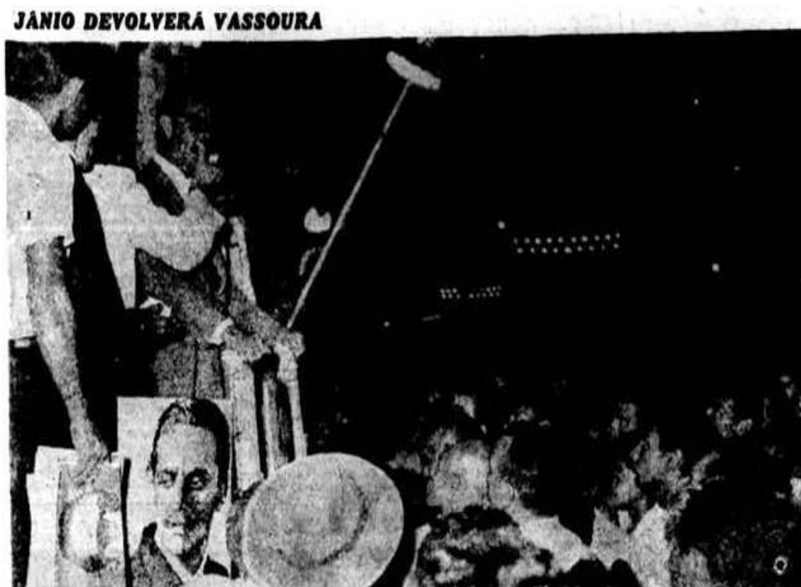
Imagem 6 — Jânio devolverá vassoura