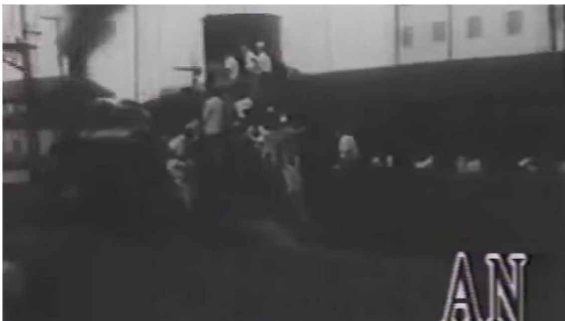
Imagem 8 — Passageiros pendurados nos vagões