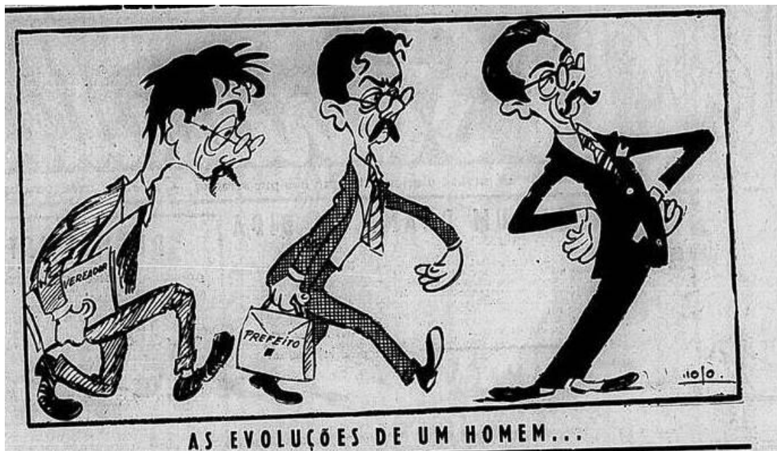
Imagem 5 — As Evoluções de um homem

Na imagem 5, o periódico projeta a carreira política de Jânio Quadros até sua chegada ao governo de São Paulo.