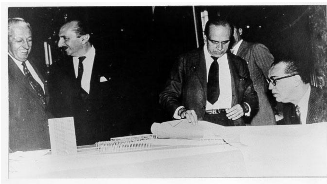
Imagem 1 — Maquete da Praça dos Três Poderes 30

Fato é que Lúcio Costa e Oscar Niemeyer ficaram responsáveis pela idealização e execução do projeto Brasília.