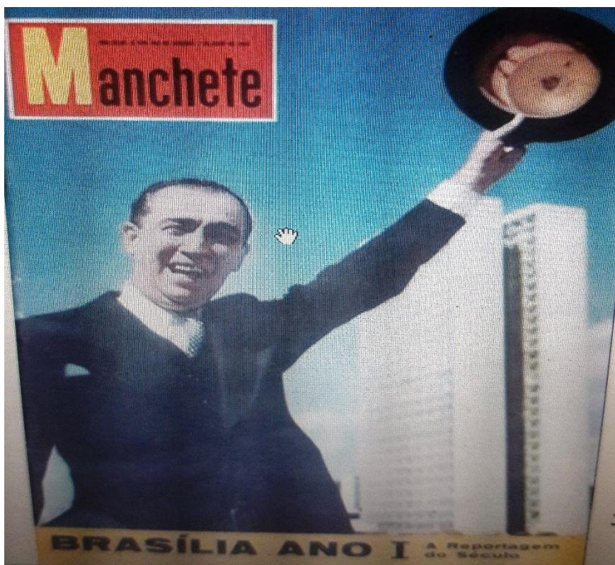
Imagem 2 — Capa da Revista Manchete Brasília ano 1 — A reportagem do século