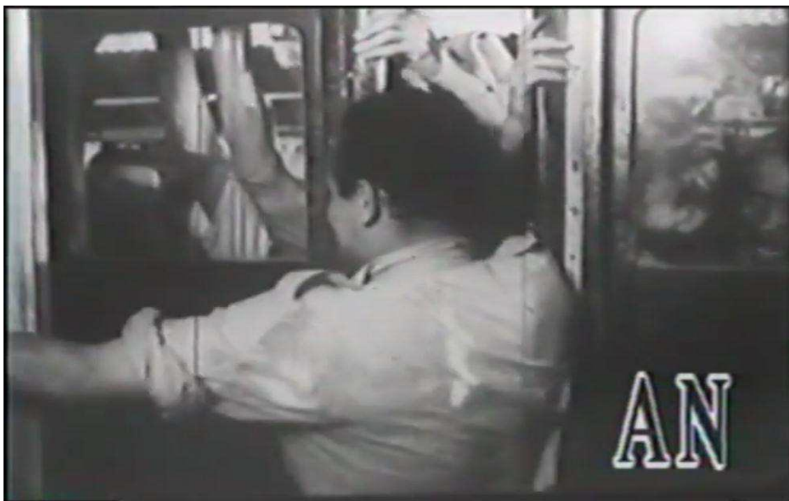
Imagem 7 — Vagão lotado