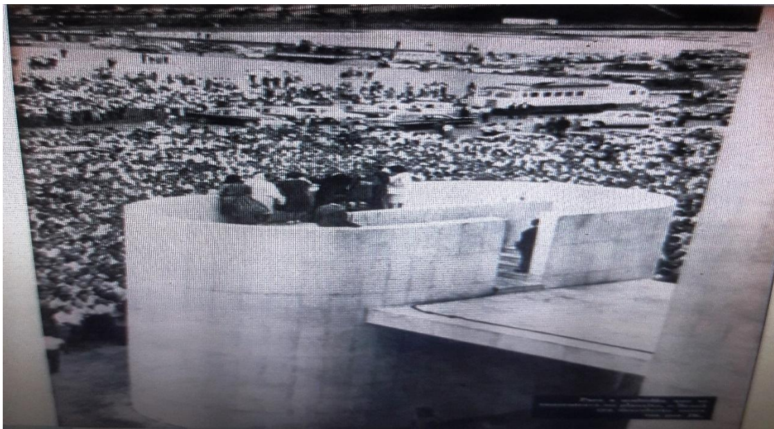
Imagem 3 — Inauguração de Brasília

Legenda: “A multidão que se concentrava no planalto, o Brasil era descoberto outra vez por JK”.