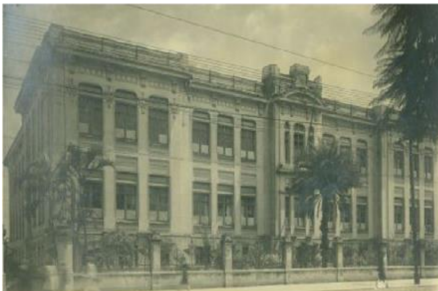
Figura 5: Edifício da Escola Normal do Brás, São Paulo, 1912