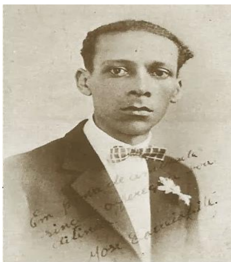
Fonte: Fotografia de José Correia Leite; fonte: “O Clarim da Alvorada,” São Paulo, 15. Jan.1927, edição 28.