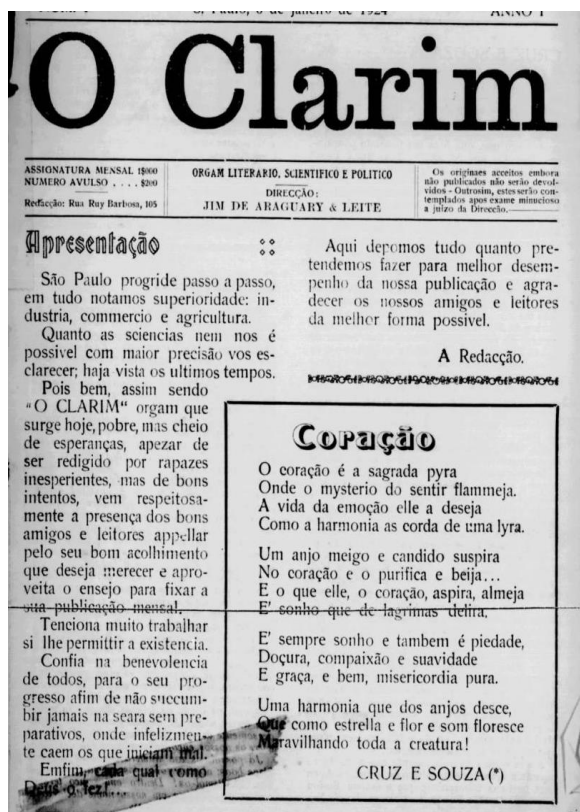
Figura 1: “O Clarim da Alvorada”, São Paulo,