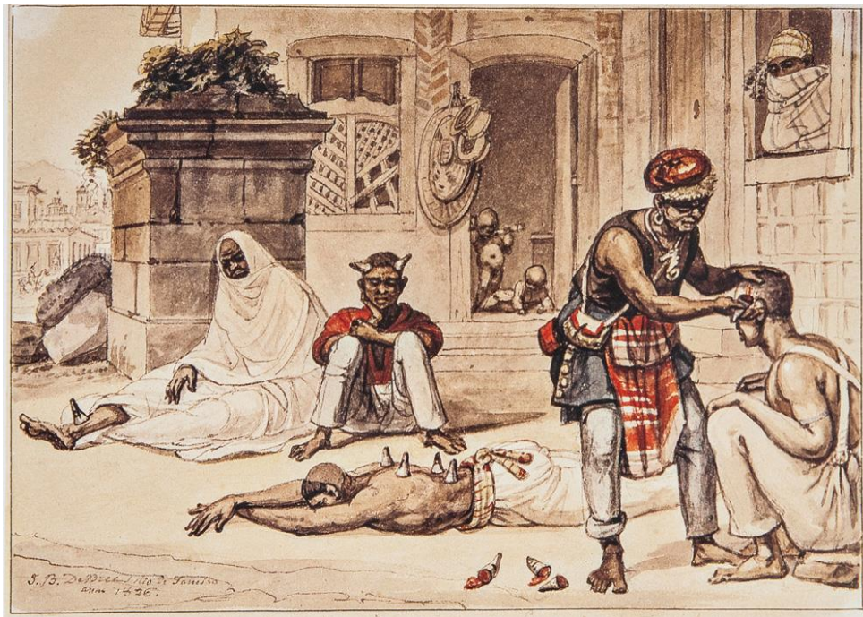
Figura 1 – Aquarela de Jean Baptiste Debret, 1826