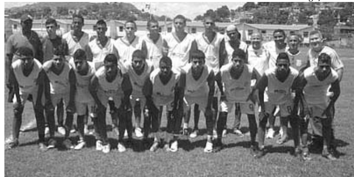
O Unidos do Cobrex entra com vantagem na final do Juvenil

Neste sábado, dia 9, será realizada a primeira partida da final entre Condor e Unidos do Cobrex, válida pelo Torneio de Verão de Futebol Juvenil, competição promovida pela Liga de Desportos de Nova Iguaçu. Na fase semifinal o Condor eliminou o Bayer após empatar a partida de ida em 0 a 0, derrotou seu adversário por 2 a 1 na partida de volta, garantindo vaga na grande final. O Unidos do Cobrex conquistou sua classificação diante do Tomazinho com uma vitória de 3 a 1 na partida de ida e um empate em 1 a 1 no jogo de volta.