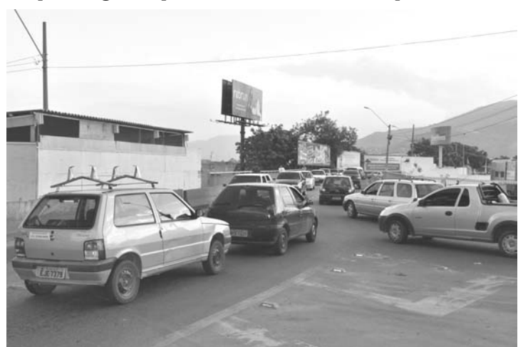
Outro panorama do viaduto no mesmo sentido, ou seja, de quem vai para o centro de Nova Iguaçu

Outras linhas passarão a seguir pela Rua Amélia Rodrigues, Rua Alexandre Fleming, Via Dutra (sentido Rio), Rua Delfina Borges, Rua Inês, Via Dutra (sentido São Paulo) e Rua do Ramalho. São elas: Auto Viação Vera Cruz - Nova Iguaçu-Belford Roxo. Viação Brazinha Ltda. - Centro-Jardim Tropical.