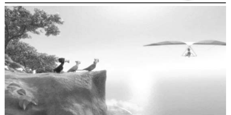
O filme Rio está em cartaz no Iguaçu Top 1