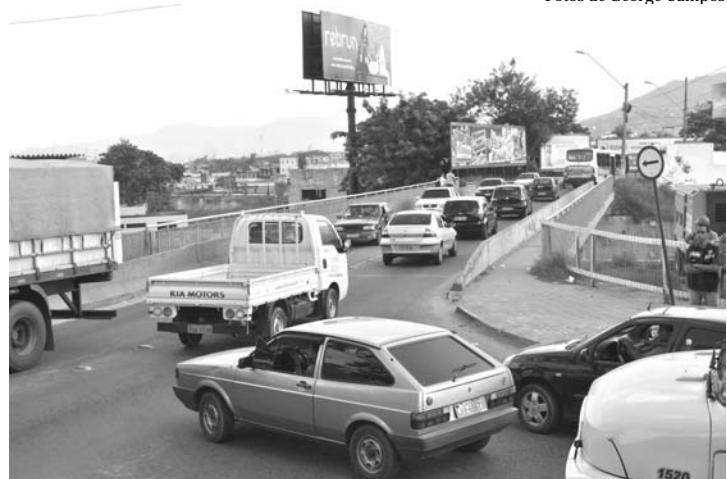
Viaduto do Posto 13, sentido de quem vai para o centro de Nova Iguaçu

Para melhorar o acesso à cidade, a Prefeitura de Nova Iguaçu, através da Secretaria de Trânsito e Serviços Públicos (Semtesp), determinou a mudança no trânsito do Viaduto do Posto Treze. Provisoriamente no período entre os dias 11 e 15 de abril, das 7 às 11 horas, o viaduto passa a ter mão única de direção no sentido centro de Nova Iguaçu.