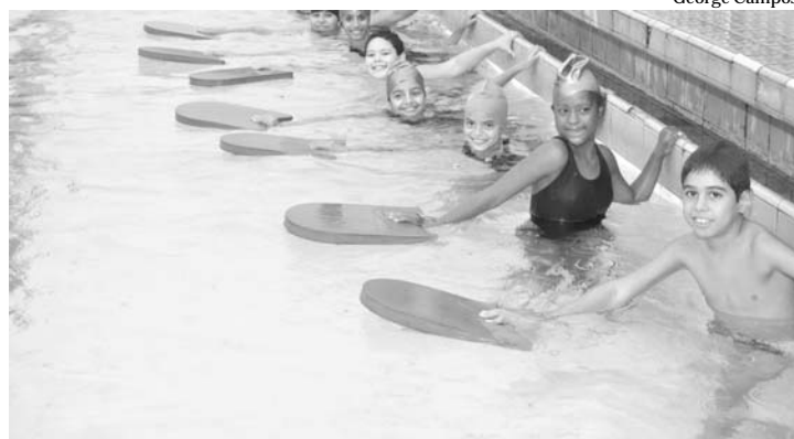
A Prefeitura de Nova Iguaçu em parceria com o Esporte Clube Iguaçu e o Iguaçu Basquete Clube, proporcionam aos jovens deste município a oportunidade de praticarem natação

Já começaram as aulas de natação oferecidas pela Prefeitura de Nova Iguaçu. A iniciativa, que faz parte de uma parceria com o Esporte Clube Iguaçu e o Iguaçu Basquete Clube, está beneficiando 120 crianças e jovens do município. As atividades acontecem nos turnos da manhã e da tarde, são gratuitas e incluem crianças portadoras de necessidades especiais.