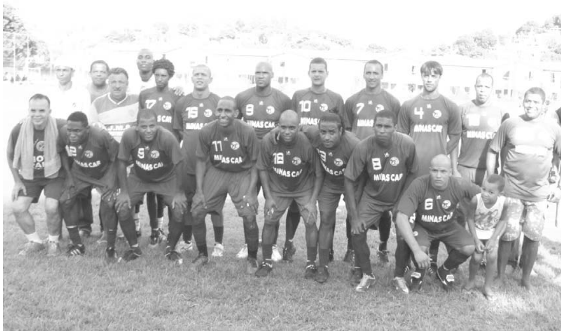
A equipe do Monte Líbano sagrou-se campeã do Torneio de Verão (Adulto) de 2011

Na grande final do Torneio de Verão (Adulto) realizada na tarde do último domingo, dia 27, no Estádio Manoel Lima Pereira, do Unidos do Cobrex, a equipe do Monte Líbano derrotou o Real de Austin pelo placar de 4 a 1, conquistando o bicampeonato do Torneio de Verão promovido pela Liga de Desportos de Nova Iguaçu.