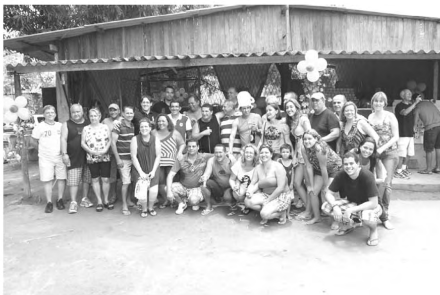
Instante em que todos os participantes do Encontro dos Primos se reuniram no Sítio do Zezé