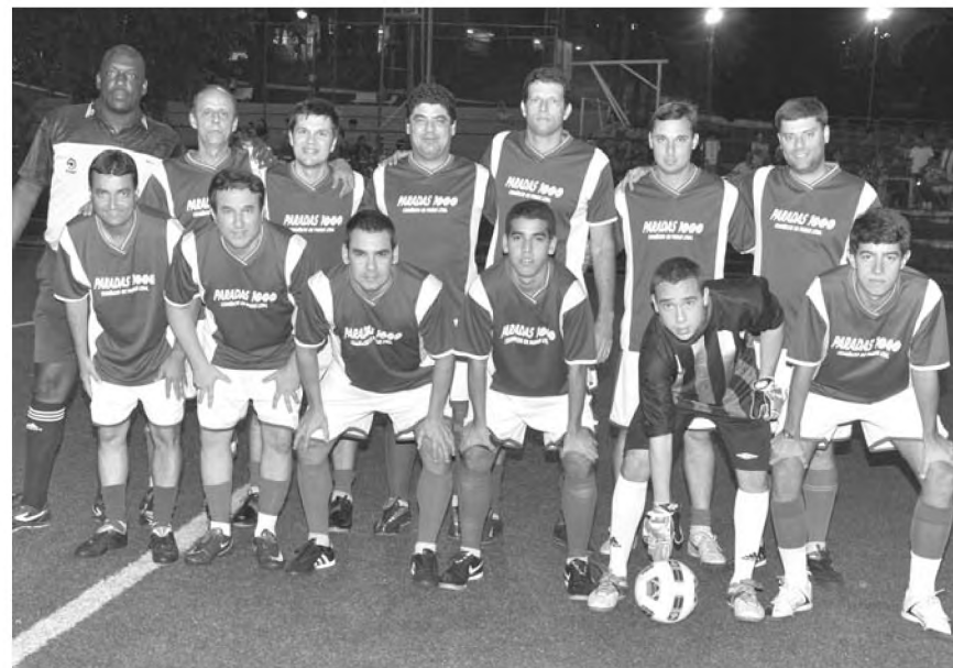
Antes do início da partida, a tradicional foto posada dos jogadores

O segundo tempo foi movimentado e muito disputado no meio de