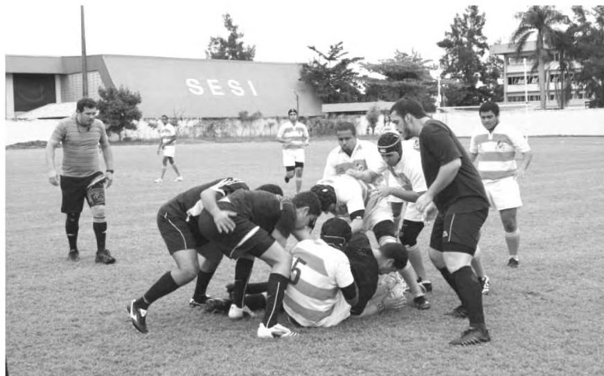
Jogo entre Maxambomba Rugby Club e Resende, em Resende

Após dois anos sem receber os visitantes em sua região de origem, a Baixada Fluminense, o Maxambomba Rugby Clube não consegue sediar os jogos em sua casa desde novembro de 2008, ano de sua fundação. O ano de 2010 se encerra de maneira feliz para a equipe da Baixada.