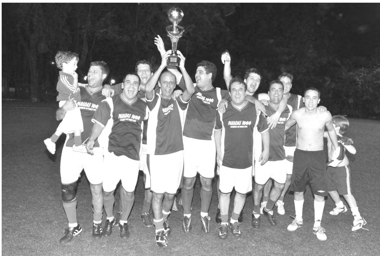
Logo após o apito final do juiz, a comemoração da equipe da Paradas 1000, grande vencedora do Torneio de Gerações

Mais uma final emocionante do Torneio de Gerações, Paradas 1000 e Antônio Micho fizeram um jogo bastante disputado durante os 70 minutos. Os associados lotaram as dependências do NICC para acompanhar a final e aproveitaram uma confraternização regada a muito churrasco, cerveja e pagode.