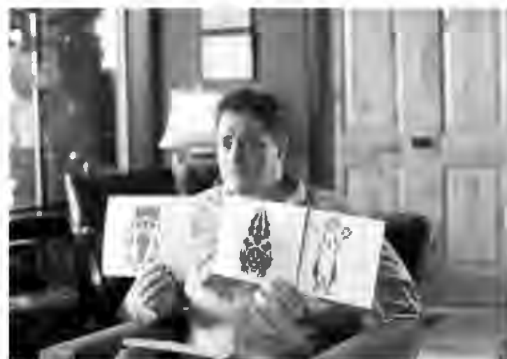
O filme "Deu a louca nos bichos" está em cartaz no Iguaçu Top 3

Grupo Severiano Ribeiro - Iguaçu Top Shopping - Telefone: 2461-2461