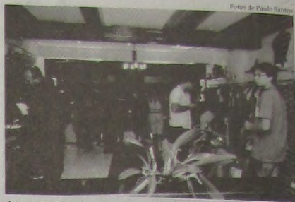
Aspecto da loja durante o desfile outono-inverno da SENSI

SENSI - Multimarcas Unisex Rua Dr. Paulo Fróes Machado, 176 - Loja Centro - Nova Iguaçu - RJ Telefone: 2668-0444