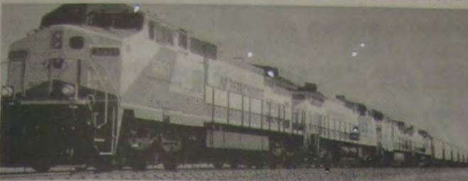
Um dos problemas identificados pelo Governo Federal é a velocidade média de 20 km/hora nos trens carqueiros do Brasil, contra os 80 km/hora verificados nos Estados Unidos e na Europa.

O rodoviatismo, quando tomou conta do Brasil, a partir dos anos 60, deixou naturalmente de lado outros meios mais importantes de transporte coletivo mais econômicos, como o fluvial, o marítimo e principalmente o ferroviário, que oferece ao usuário fretes mais baratos, devido ao seu baixo custo de manutenção.