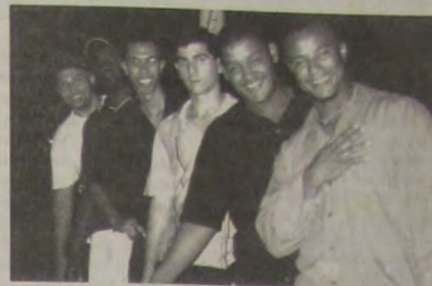
Flash do Grupo Swing da Cor.