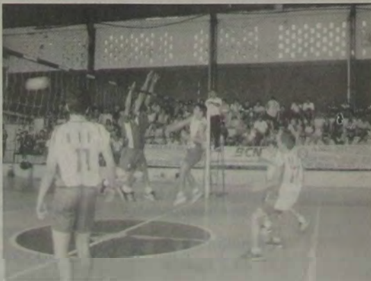
Os jogos do Torneio Início apresentaram excelente nível técnico. Destaque para a equipe do Instituto Iguaçuano, campeão nas categorias Mirim e Infantil.