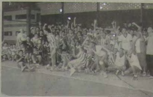
300 atletas se inscreveram para a disputa do Campeonato Iguaçuano de Vôlei

Neste sábado, teremos a realização da primeira rodada do Campeonato Iguaçuano de Vôlei, com as seguintes partidas: categoria Mirim (masculino), às 9 horas, no ginásio do Sesc, com as partidas IBC x ABEU, e às 10 ho-