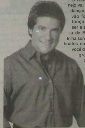
aos moldes dos grandes sucessos das pistas de dança do mundo agora.

O Remixes Hits Sertanejo vai fazer todo mundo dançar, e nem os peões vão ficar de fora! Este lançamento promete ser a sensação da Festa de Barretos e será a trilha sonora das principais boates da região. Imagina você dançar ao som dos grandes sucessos de Daniel (foto), Rick & Renner, Dallas Company, Leandro & Leonardo, Bruno e Marrone, Gino e Geno, e muito mais, so que... em versões dançantes, totalmente remixadas aos moldes dos grandes sucessos das pistas de dança do mundo agora.