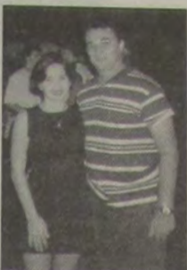
Casal Ewaldo Andrade