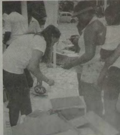
A ONG Busca ao Próximo distribui roupas e alimentos a população de rua em Nova Iguaçu.

Os interessados em obter maiores informações sobre esse trabalho poderão ligar para 2668-3080, 3066-2187 ou 9298-7426.