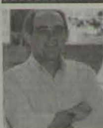
Renato Aragão é o protagonista de "Cupido Trapalhão", filme em cartaz no Cine Verde 1.