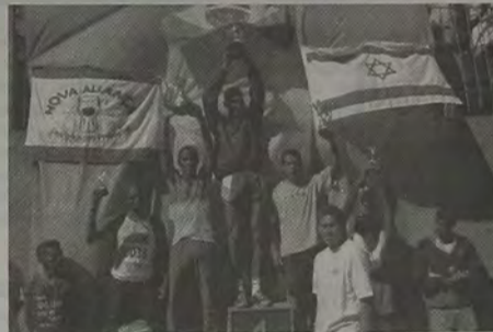
O pódio masculino da 2ª Corrida Rústica

As estatísticas revelaram um número considerável de atletas profissionais participando do evento. Dos 83 corredores, 51 eram profissionais e 32 amadores. A estatística revelou ainda que 45 eram profissionais evangélicos, 38 não evangélicos e 21 eram de Queimados. Outro destaque da 2ª Corrida Rústica foi a faixa etária elevada dos atletas. Cerca de 40 tinham acima de 28 anos e apenas nove estavam na faixa dos 15 aos 19 anos.