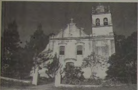
A Igreja do Pilar, em Caxias.

A abertura da exposição "Baixada Fluminense - outras imagens" aconteceu no último sábado (08.02), e se estenderá até o dia 16 de março, das 9 às 18 horas no Sesc-Nova Iguaçu. A entrada é franca. O Sesc fica na Rua D. Adriano Hipólito, 10 - Moquetá - Nova Iguaçu.