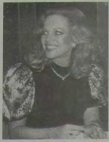
Marta Rocha, eterna Miss Brasil, presença no júri do concurso Miss Estado do Rio, dia 22 de março, na Riosampa