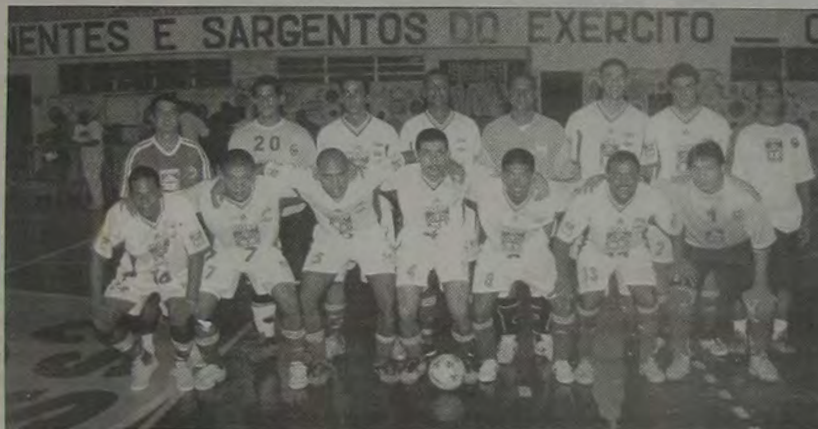
A equipe do Hosp Rio, vice-campeã da Taça Rio de Janeiro de Futsal.