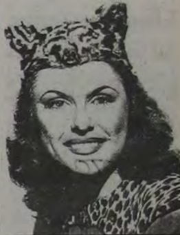
Linda Stirling foi considerada, na década de 40, a rainha dos seriados. Ela era realmente linda, maravilhosa, na pele (literalmente) da "Mulher Tigre", no seriado "A Mulher Tigre" e em outros, como "A Ilha Misteriosa", "O Chicote do Zorro" e "O Fantasma Escarlata".

"A Mulher Tigre" (The Tiger Woman, 44), também fez enorme sucesso na época. Linda Stirling, na pele de uma tigresa, numa mini-saia de couro que deixava a gurizada em polvorosa. O mocinho era Allan "Rocky" Lane e que depois se tornaria somente Rocky lane em filmes de cowboy. Outros seriados que fizeram sucesso foram "O Dragão Negro" (G-Men vs. Black Dragon, 43) e "Maravilhoso Mascarado" (The Mask Marvel, 43). Em ambos os seriados, em plena Segunda Guerra Mundial, agentes e espíões japoneses invadiam os Estados Unidos para espionar e sabotar refinarias de petróleo e roubar fórmulas e segredos de Estado. Em "A Era do Rádio" (Rádio days, 87), Woody Allen olha o passado com carinho nostálgico e lembra um personagem do rádio, da TV e dos seriados, "O Aranha Negra". Em "O Império Submarino" (Undersea Kingdom, 38), ficção científica que falava de um império submerso que ameaçava o mundo da superfície, há uma nave (um foguete) cujas linhas aerodinâmicas lembram a famosa Interprise, da série de TV "Jornada nas Estrelas".