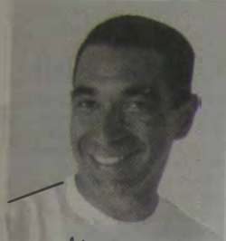
Zinho leva muita fé no seu projeto de criar um Centro de Futebol em Nova Iguaçu.

Decepcionado com o projeto esportivo do Nova Iguaçu FC, do qual era um dos sócios, o jogador de futebol Zinho - tetra-campeão mundial em 94 - decidiu montar o seu próprio Centro de Futebol.