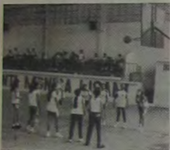
As modalidades de basquetebol e futsal serão as atrações para este ano no Lisam.