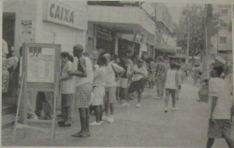
Os usuários da Caixa Econômica Federal (agência Marechal Floriano) são vítimas, diariamente, de uma verdadeira tortura, em filas intermináveis onde a entrega das senhas quase sempre vem acompanhada de uma frase debochada por parte de seus funcionários.