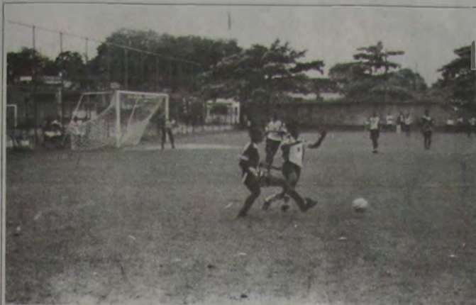
No primeiro amistoso do time do "Campo dos Sonhos", o adversário foi a equipe infantil do Botafogo FR, que teve de suar a camisa para derrotar a garotada de Cabuçu pela contagem de 2 a 1.

Ha exatos seis meses, 250 jovens do bairro Cabuçu, neste município, estão tendo a oportunidade de praticar esportes, distanciando-se das drogas. Eles fazem parte do projeto "Campo dos Sonhos", monitorado pela organização não-governamental intitulada Serviço Social Brasileiro (SSB), também sediada em Nova Iguaçu.