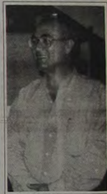
O Prefeito Nelson Bornier