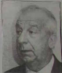
JOSÉ TÁVORA Deputado Estadual

Ao completar 85 anos de existência, o Correio da Lavoura atinge uma grande marca como veículo que, por sua perenidade, merece de todos nós, iguacuanos, o respeito devido àqueles que souberam sustentar, até os dias de hoje, os princípios lançados por Silvino de Azeredo a 22 de março de 1917