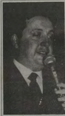
O Governador Anthony Garotinho

camente obras de saneamento, drenagem e asfaltamento. Do que já foi feito, fontes oficiais garantem que 100 bairros já foram beneficiados, num total de 250 quilômetros de obras.