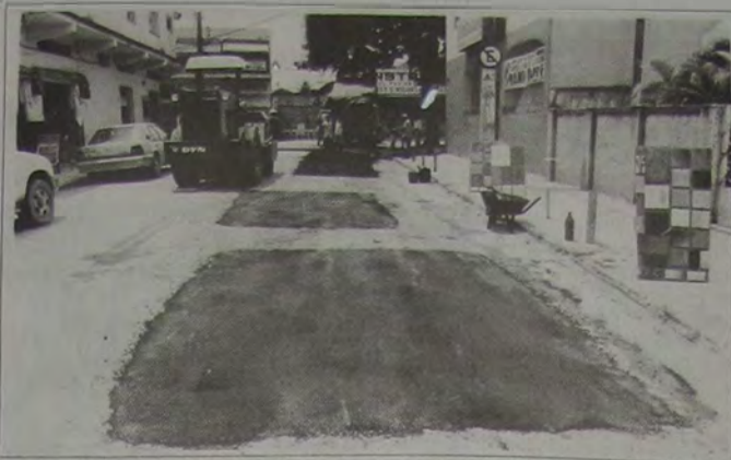
Aspecto dos trabalhos de recuperação que estão sendo realizados na Rua Laerte Acácio da Silva, no centro de Queimados.

A Secretaria de Obras e Serviços Públicos de Queimados vem realizando serviços de recuperação das vias públicas que sofreram com as fortes chuvas que caíram sobre a região sobretudo em janeiro e fevereiro. Entre os fatos que ocorrem todos os anos durante o verão. Segundo o Secretário de