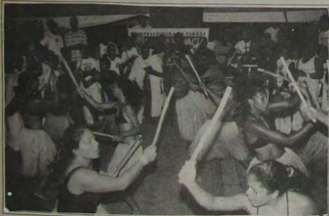
A apresentação do maculelê provocou grande interesse nos populares que estiveram presentes na Praça da Liberdade, no último dia 20. Leia na página 6