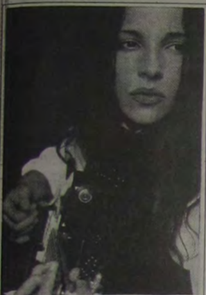
A bela cantora Ana Carolina já vendeu 250.000 cópias do seu álbum Ana Rita Joana Iracema e Carolina.

As novas estrelas femininas da MPB estão tomando conta do mercado. Ana Carolina, Adriana Calcanhotto, Zélia Duncan e Cássia Eller. Com um público super fiel, principalmente o feminino, elas estão imbatíveis, com uma vendagem nunca inferior a 100.000 cópias a cada lançamento. Adriana Calcanhotto, a líder em vendas, chegou a