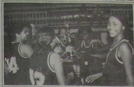
As meninas do CR Caxiense vibrando com a Taça

No segundo tempo, o Caxiense voltou melhor. A arma-