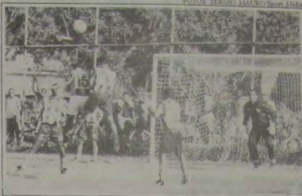
Os jogos do Campeonato Iguaçuanense têm sido disputados nos