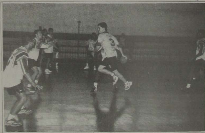
As equipes do Cemor e da EE Dr. Mário Guimarães vão abrir a terceira rodada.

Neste sábado, dia 27, a partir das 11 horas, no ginásio do Iguaçú Basquete Clube (IBC), três jogos vão movimentar o Campeonato Iguaçuanense de Handebol Juvenil (categoria masculina).