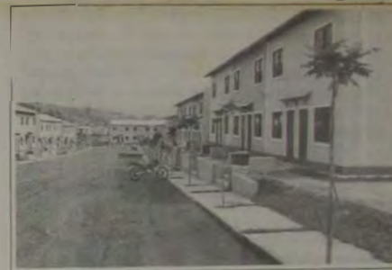
O Conjunto Residencial Adrianópolis fica no Bairro Botafogo.

Com um potencial imobiliário de 1.500 unidades habitacionais ao ano, a Prefeitura de Nova Iguaçu realiza de 1 a 4 de novembro, no Iguaçu Top Shopping, a I Feira da Casa Própria da Cidade. Um evento que já conta com 22 construtoras ocupando 24 estandes. Na ocasião, será lançado em Cabuçu uma cidade para 150 mil pessoas, com shoppings, farmácias, escritórios de serviços, vilas, apartamentos e casas. O empreendimento, democrático como toda cidade deve ser, atenderá da baixa a média renda familiar. O primeiro investimento no local será do Programa de Arrendamento Residencial (PAR), da Caixa Econômica Federal, uma das parceiras do evento.