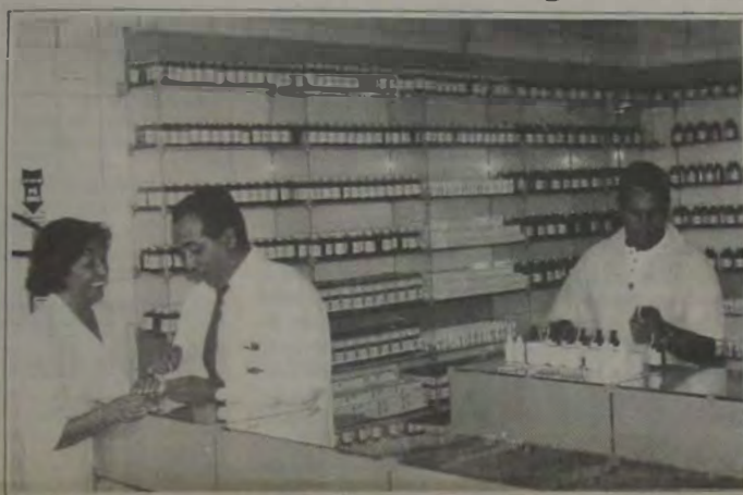
É considerável o estoque de medicamentos genéricos na Farmácia da UNIG, em Mesquita.