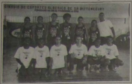
A equipe feminina infanto-juvenil de Angra dos Reis

Oito equipes vão participar da 1ª Copa Rio de Basquetebol (categorias masculina e feminina). A competição será disputada na segunda quinzena de novembro.