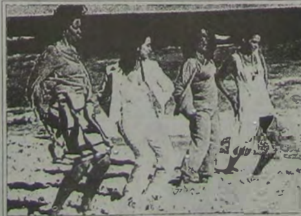
"A Partilha", em cartaz no Cine Center 1

O Cine Verde anuncia para domingo, dia 5: a continuação do filme em série e o drama "A condessa se rende", com Betty Grable e Douglas Fairbanks Jr.