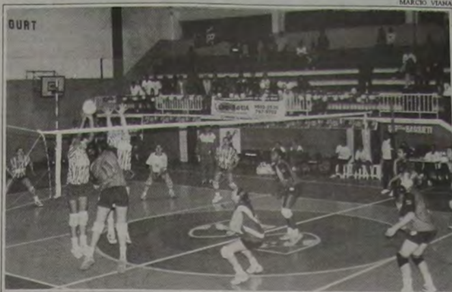
O vôlei feminino fará o jogo de abertura do II Movimento Olímpico.

A modalidade de vôlei feminino será o jogo de abertura do II Movimento Olímpico da Baixada, neste domingo, dia 12, a partir das 9 horas, na quadra do ginásio do Iguaçu Basquete Clube.