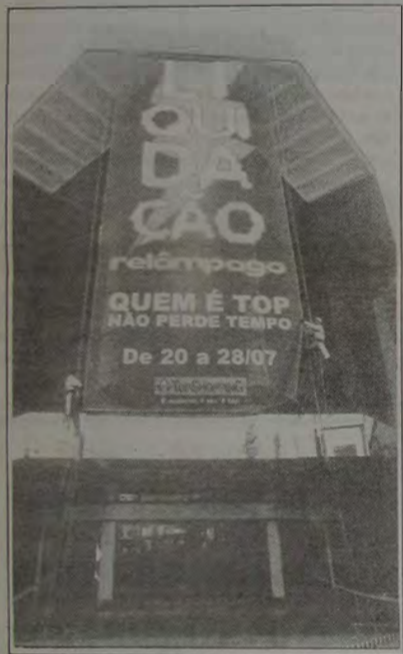
Equipe de alpinistas na instalação do painel

O Departamento de Sinalização do Top Shopping criou um projeto inovador para a fachada do Top Shopping em Nova Iguaçu. Devido ao fato da fachada frontal ser totalmente envidraçada, não poderia ser utilizada estrutura de ferro, de modo que não houvesse riscos de danificá-la. Pensando assim, Gustavo Távora, diretor da agência e autor do projeto em parceria com a equipe de manutenção do Shopping, optou pela utilização de cabos de aço e esticadores, 2 (dois) instalados verticalmente e 2 (dois) horizontalmente, formando um quadro onde foi fixado um painel de noventa metros quadrados em lona sanet, lona esta que é perfurada para diminuir a ação do vento e será utilizada pelo marketing do Shopping para a exposição das mensagens de campanhas publicitárias sazonais.