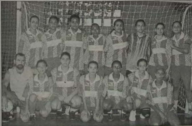
Equipe do CE Antônio da Silva.