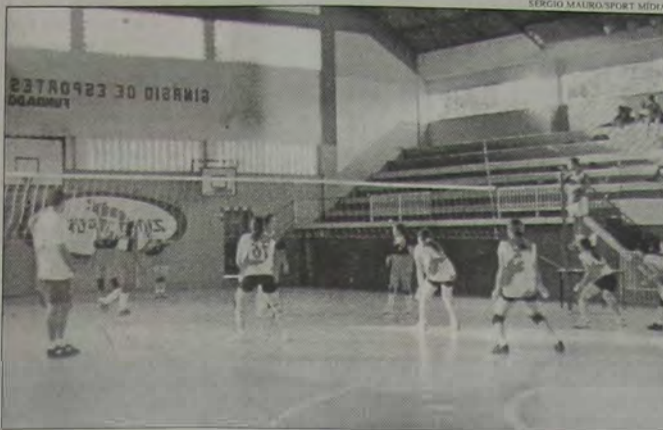
O entrosamento é um dos pontos fortes do IESA.

A Federação de Vôlei do Rio de Janeiro (FVR) confirmou que o Torneio Início (categoria juvenil, masculino e feminino) será disputado hoje (sábado) à tarde, a partir das 12 horas, no ginásio do SESC, no bairro Moquetá.