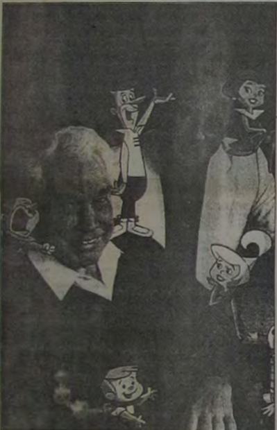
Hanna e Barbera formaram uma empresa para competir no mercado de desenhos animados com o então poderosíssimo Walt Disney. Os seus personagens, na sua maioria, eram animais humanizados, como Maguila - o gonla, Dom Pixote, Manda-Chuva, Zé Colmeia, Pepe Legal e muitos outros. Na foto, Hanna é o da direita, roteirista das aventuras dos personagens criados por ele e pelo amigo Barbera.

Agora veio a notícia do falecimento de William Hanna, e isso nos deixa saudades de uma época em que os desenhos animados eram animação e divertimento, sem violência. Hanna e Barbera criaram uma empresa de produções de filmes de animação, única a competir com o poderosíssimo Walt Disney.