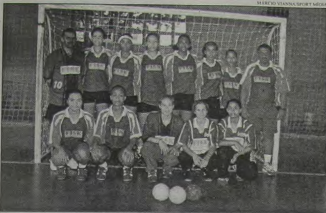
A equipe do Nilópolis Handebol Clube.

A Baixada Fluminense terá dois representantes no Campeonato Estadual de Handebol (feminino), categoria juvenil: Nilópolis Handebol Clube e o Belford Roxo. Além dos representantes da Baixada, estarão na competição as equipes do Vasco, Fluminense, Mauá e Niterói.