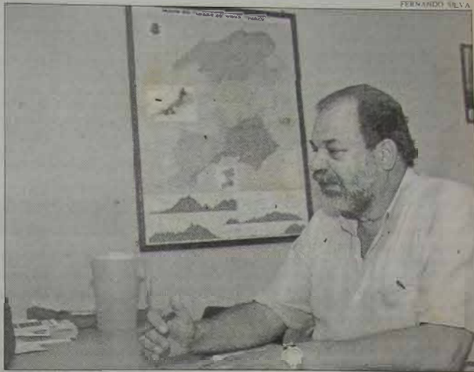
O Secretário de Saúde Gilberto Badaró considera de suma importância a cooperação da Secretaria de Educação, na batalha de combate à dengue.

Apesar de terem sido registrados apenas 2 casos de dengue tipo 3, o secretário informou que "até agora houve suspeita de 1890 casos de den-