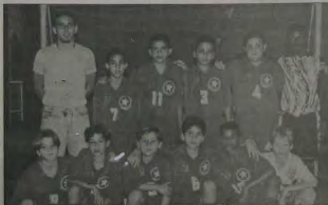
O Brax de Pina Country Club já confirmou presença na Copa Rio Mirim 2000.

A Esporteon e o SESC/Nova Iguaçu estão estudando a possibilidade de organizar ainda este ano a primeira Copa Rio de Futsal Mirim , para atletas nascidos a partir de 1988. A competição terá o início previsto para o dia 25 de novembro e o término para o dia 9 de dezembro.