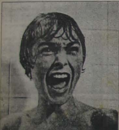
Janet Leigh na cena antológica do banheiro, em Psicose , um dos momentos máximos do suspense na primorosa e revolucionária obra cinematográfica de Hitchcock.

Sua origem britânica deve ter lhe dado elementos psicológicos para desenvolver a sua arte. Londres, com o famoso Big Ben, cujas batidas sinistras fazem parte da literatura policial inglesa. As sombras e neblinas do fog inglês e Sir Arthur Doyle, criador do também famosíssimo detetive Sherlock Holmes. Sem falar nos castelos assombrados, com seus fantasmas seculares (vide Rebecca , 40). Tudo isso, com certeza, ajudou Hitchcock a criar seu mundo, onde o homem aparece não como um ser perfeito, mas falho e vulnerável. Onde, inocente (vide The Wrong Man , 57). A Lei é falha, como o homem é falho. O homem é destruidor da natureza, é predador (vide The Birds , 63). Hitchcock também tinha uma obsessão pelo crime perfeito (vide Dial M For Murder , 60 e Marnie , 64).