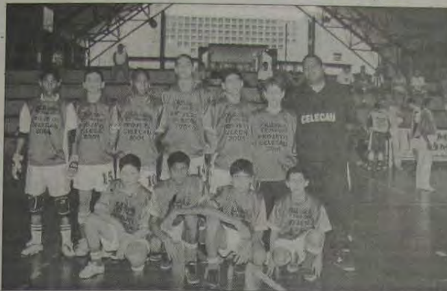
A equipe da Celecau, líder da Copa Rio de Futsal Infantil.

Valendo pela segunda rodada da III Copa Rio de Futsal (categoria Infantil), a equipe da Celecau venceu com extrema facilidade o SC Meriti por 21 a 2, em partida realizada neste último domingo, dia 29, às 9 horas. No outro jogo da rodada o EC Iguaçu venceu por 6 a 2 o time do Vasquinho de Morro Agudo. Os gols do EC Iguaçu foram assinalados por