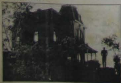
O casarão sinistro serviu para ambientar as cenas mais fortes de Psicose (1960).

E Psicose , que está fazendo 40 anos, merece ser parabenizado, pois trata-se de uma obra-prima. Realizado no seu momento mais criativo, inovador de uma linguagem cinematográfica dos filmes de suspense. Sempre imitado. O filme que mais influência exerceu e continua a exercer no cinema, onde a figura do psicopata (Anthony Perkins, em sua melhor interpretação), que ataca com um facão, tornou-se presença obrigatória nos filmes de suspense modernos. A cena do banheiro é antológica. A fotografia em preto-e-branco de John L. Russell e o planejamento visual de Saul Bass dão o clima, criam a atmosfera das imagens. A trilha sonora de Bernard Herrmann é eletrizante. Um tal de Gus Van Sant fez uma Psicose em 98. Vejam essa bobagem colorida, e curvem-se diante do mestre e dos 53 filmes que realizou.