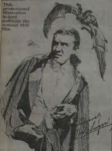
Tipica ilustração promocional dos filmes de um dos ícones do terror no cinema, o legendário Bela Lugosi. A ilustração é de 1931.

O que metia de medo nos magnatas da Universal, no início da década de trinta, o auge da Depressão americana, não eram os vampiros, lobisomens ou ghosts, mas sim a situação financeira quem estava levando o estúdio à falência. E para salva-lo dessa situação, entraram em cena os filmes "Drácula" (Dracula, 31), de Tom Browning, com Bela Lugosi no papel-título, "Frankenstein" (Idem, 31), de James Whale, com grande atuação de Boris Karloff e a "Múmia" (The Mummy, 32), de Karl Freund, também com Karloff.