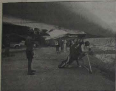
A rampa de Japeri, um verdadeiro sucesso na Baixada.