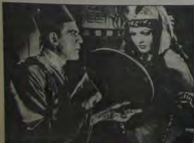
Filme dos anos 30. Aqui aparece outra lenda dos filmes de terror, Boris Karloff (esquerda), numa cena do filme "A Múmia", ao lado de Zita Johann.

Como vêem, a coisa aqui está preta. Está tão preta que até o Halloween já baixou por aqui. Nas escolas, nos clubes, nos shoppings e no lazer da nossa juventude. Com isso nossa juventude está cada vez mais alienada. Eles não têm culpa de curtir essa fantasmagoria alienígena. Mas pelo menos os promotores dessas monstruosidades poderiam ser mias criativos. Por que não buscar no nosso folclore as entidades encantatórias para desfilar nessas passarelas - o Saci-pererê, a Mula sem Cabeça, o Boi-Tatá, o Caipora, o Uirara - e tentar equilibrar esse terror cultural que nos invade?