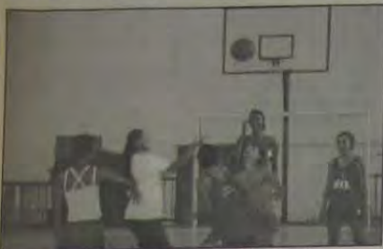
Treino de basquete, no ginásio da Vila Olímpica.

Encerrou-se ontem com absoluto sucesso mais uma Colônia de Férias na Vila Olímpica de Nova Iguaçu, que este ano contou com a expressiva participação de 250 atletas mirins, na idade de 7 a 14 anos, para ambos os sexos, tudo sob os auspícios da Secretaria Municipal de Cultura, Esporte e Lazer de Nova Iguaçu.