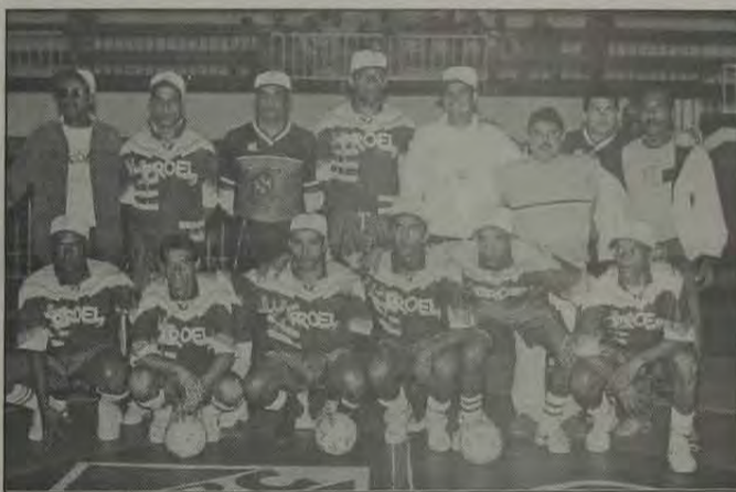
A equipe do Proel, Campeã da Taça Cidade de Futsal.