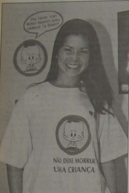
A atriz Samara Felipo

A desnutrição materno-infantil é uma das causas da morte de milhares de mulheres e crianças em todo o País.