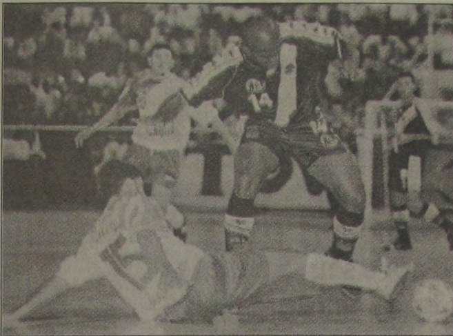
Mickey (14), tenta fugir da forte marcação da equipe catarinense.

Mesmo sem fazer uma grande partida, o super time de futsal do Vasco da Gama derrotou o Jaraguá (SC) pela contagem de 7 a 4, em partida disputada em São Januário, no último dia 22, terça-feira, às 19 horas. Além do Vasco e do Jaraguá, participam também