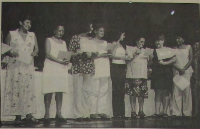
As alunas quando exibiam seus diplomas por ocasião da solenidade de formatura.

Indicado para um prêmio internacional promovido pela Organização das Nações Unidas (ONU), o Curso de Alfabetização de Mulheres Adultas, organizado pela Coordenadoria de Projetos Especiais de Nova Iguaçu, formou mais uma turma na tarde de terça-feira, dia 22. São mais de 860 mulheres e jovens que saíram da "cegueira" e que começaram a ver o mundo melhor através da leitura. Durante a formatura, os formandos manifestaram, através de cartazes, seu sentimento de força e gratidão pela vitória alcançada.