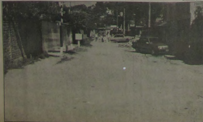
A foto revela o abandono a que está entregue a Rua Pau Brasil, no bairro Boa Esperança.

Projeto de Educação de Nova Iguaçu forma mais 860 mulheres