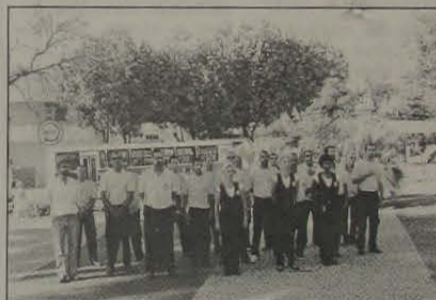
Defesa civil, sempre presente.