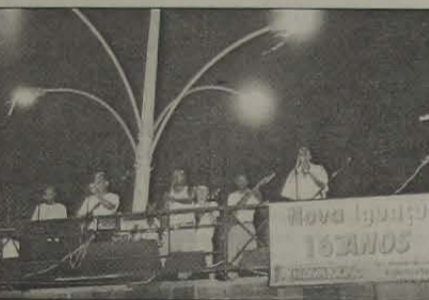
Festa no bairro Cosmorama.