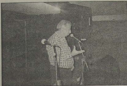
Em coquetel organizado pela coluna.