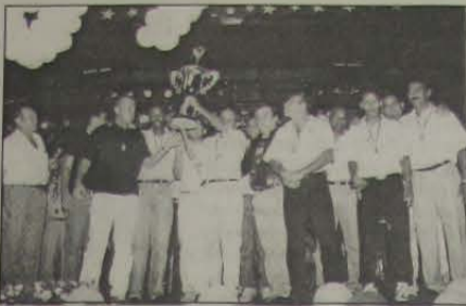
Campeonato Inter-secretarias - Campeã: COSITRAN.