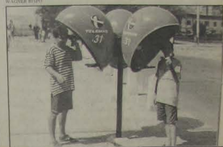
Dez orelhões mudos estão provocando irritação nos usuários que transitam na R. Dom Walmor, no trecho entre a Via Light e a Rua Athaide Pimenta de Moraes.