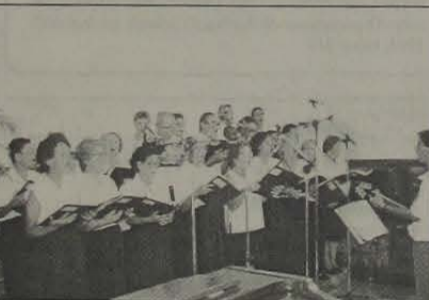
Coral da Igreja Bom Pastor.