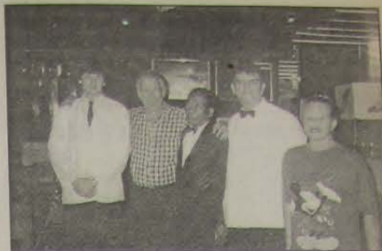
Com a turma do Hollywood Disco Club