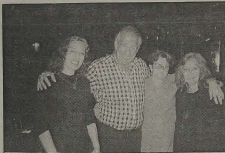
Em roda de amigos