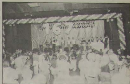
Baile da Cidade na Riosampa.