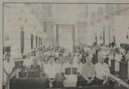
Missa Solene na Catedral.