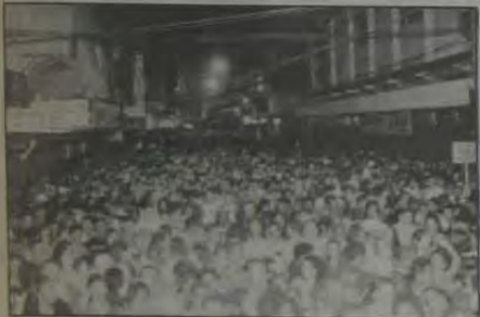
Em todos os dias da Festa de Santo Antonio, a multidão lotou a Av. Nilo Peçanha, para assistir aos vários shows ali programados.