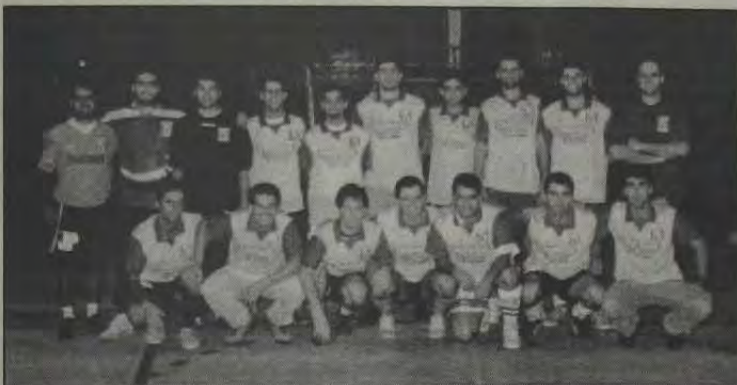
A equipe do Country Club (foto acima) surpreendeu o Tênis Clube de Mesquita ao empatar em 5 a 5, no último jogo. O Tênis Clube ocupa a 2ª colocação no campeonato da "Taça Cidade".

Valendo pela segunda fase da competição, o Tênis Clube de Mesquita enfrentará o NICC (Country Club) na segunda-feira, dia 21, às 21 horas, no Ginásio do Esporte Clube Iguaçu. Quem vencer ficará com uma das vagas na semifinal do campeonato; o TC Mesquita jogará pelo empate por ter obtido a melhor campanha no período da primeira fase.