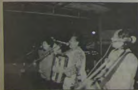
O conjunto Águias do Forró fez vibrar a grande platéia que assistiu aos shows no palanque armado na Av. Nilo Peçanha.