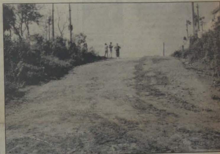
Em N. S. da Graça, os moradores fizeram sérias reclamações sobre o estado de abandono em que se encontra o bairro.