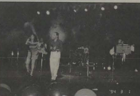
A excelente performance da Banda Sabor de Maçã