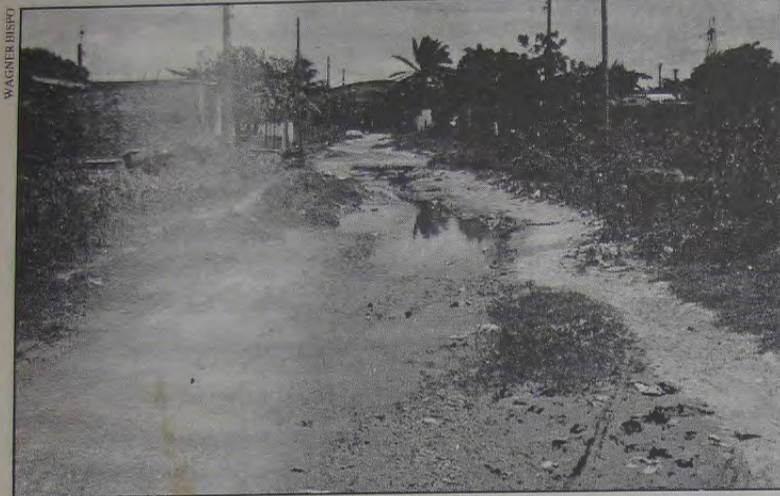
Para os moradores de Nova Era "não existe governo em Nova Iguaçu" em razão do péssimo estado em que se encontram as ruas do Bairro.

A situação dos moradores da Rua Sheila Biondino, no Bairro Jardim Nova Era, em Nova Iguaçu é de calamidade pública. Lá não existe esgoto, água encanada e as lâmpadas dos postes públicos estão queimadas, precisando serem trocadas. Lá o que existe são valas de água podre e estagnada e muito mato onde proliferam nuvens de mosquitos, trazendo febre e doenças nos moradores. Quando chove a rua fica inundada, invadindo os quintais e casas, contaminando os poços e pondo em risco a saúde de todos. A rua, não tem nem aparência de rua, devido aos buracos e bolsões d'água que impedem o tráfego de qualquer tipo de veículo.