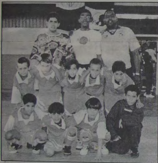
A equipe Pré-Mirim da Toca da Cerâmica

Esta vitória, depois de derrotas nas duas primeiras partidas iniciais, vem demonstrar que o investimento para um trabalho continuado, perseverante, mais cedo ou mais tarde começa a apresentar os seus resultados. E esta vitória, domingo passado, sobre o Vasco já é um sinal de que a Toca da Cerâmica chegou para dar trabalho aos seus futuros adversários.