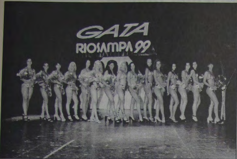
As finalistas do concurso Gata Riosampa 99.