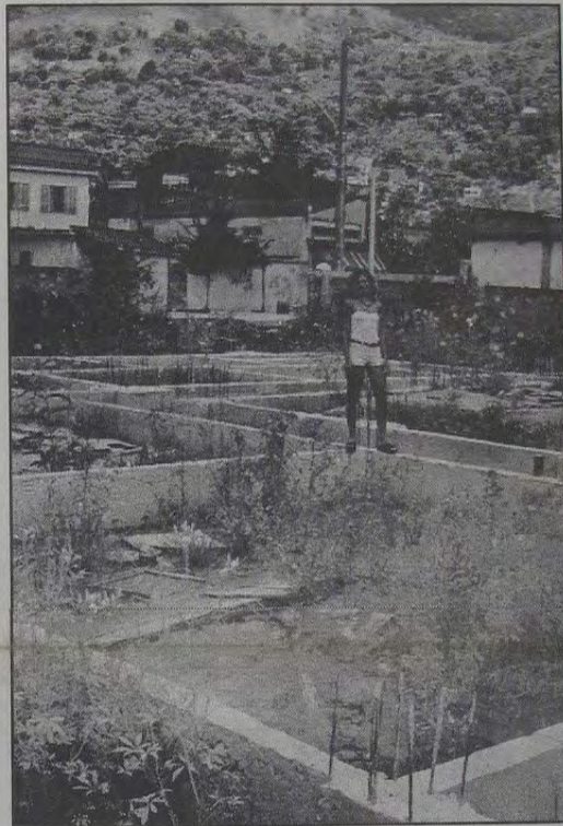
São poucas as esperanças dos moradores da Chatuba, no sentido de que o projeto Baixada Viva seja reativado.