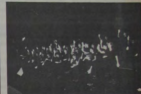
Foto nº 2 - Lirismo e ternura na apresentação comovedora do CORAL DO CIESP. Foram momentos emocionantes, pois os participantes são alunos portadores de problemas especiais. Mesmo sem audição demonstraram grande sensibilidade, ao se apresentarem no palco da RioSampa no evento IGUAS-ARTES.