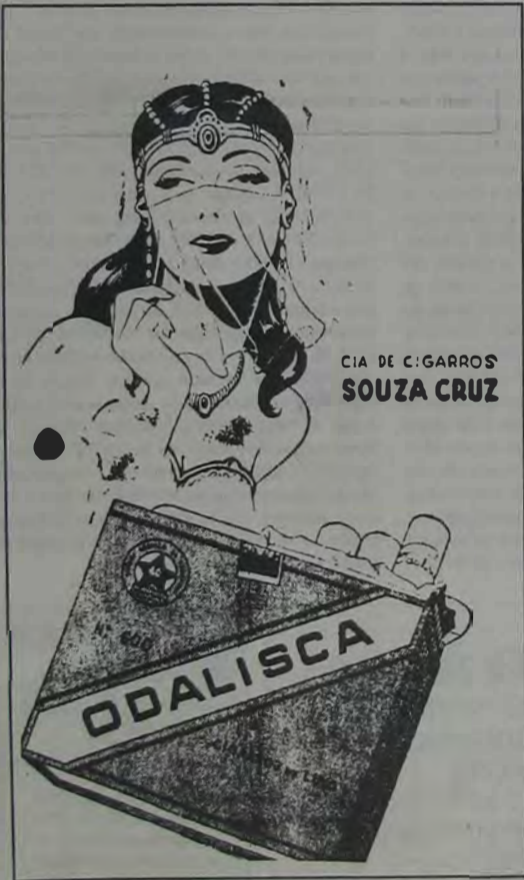
CIA DE C. GARROS SOUZA CRUZ