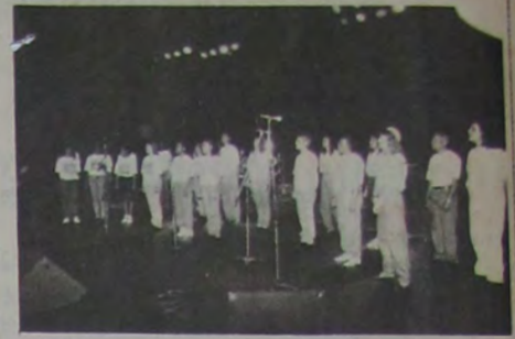
Foto nº 1 - O coral da Casa de Cultura abriu de forma brilhante a 1ª SEMANA CULTURAL DE NOVA IGUAÇU, fazendo grande sucesso no palco da RioSampa.