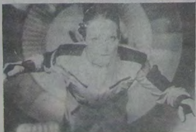
Jody Foster é a astrônoma, na boa ficção científica de Robert Zemenckis

CINEMA 3 - "Mr. Bean - o filme" (comédia), 6ª semana. Censura: livre. Horário: 16h40m - 18h30m e 20h20m. Sábado e domingo, a partir das 14h50m.