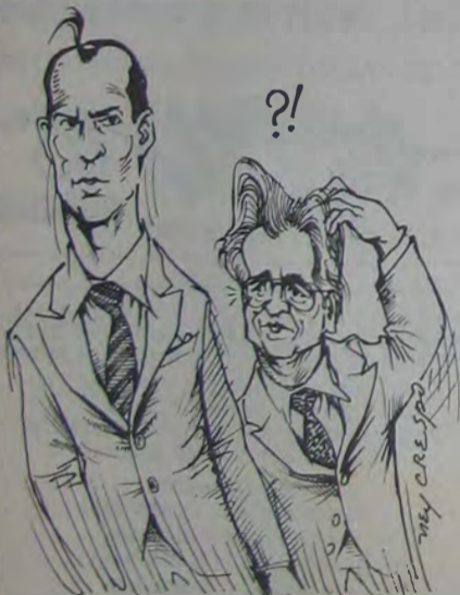
CIRO E... O INÍCIO DA NOVA CIRANDA ELEITOREIRA!