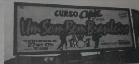
Um som bem brasileiro

"Um som bem Brasileiro". Este é o título do programa da próxima semana, que acontecerá sábado que vem, na sede do SESC/Nova Iguaçu. O evento musical terá a participação dos alunos e professores do Curso Clave de Música, com o apoio da Secretaria de Cultura, Esporte e Lazer.