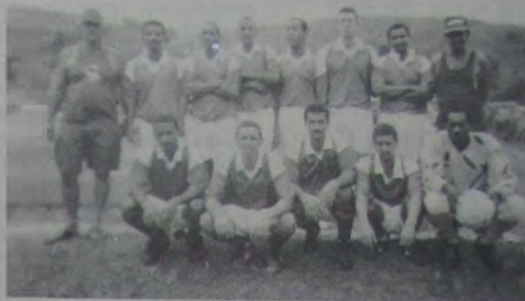
O Mancha Azul melhorou sua posição no campeonato.