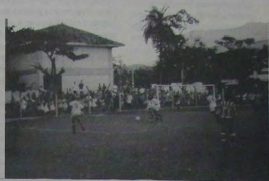
O Estádio Caxixão, em Santa Rita, recebeu um bom público.