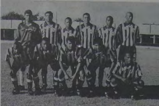
Os alvinegros começaram a competição empatando três jogos. Em seguida vieram as vitórias