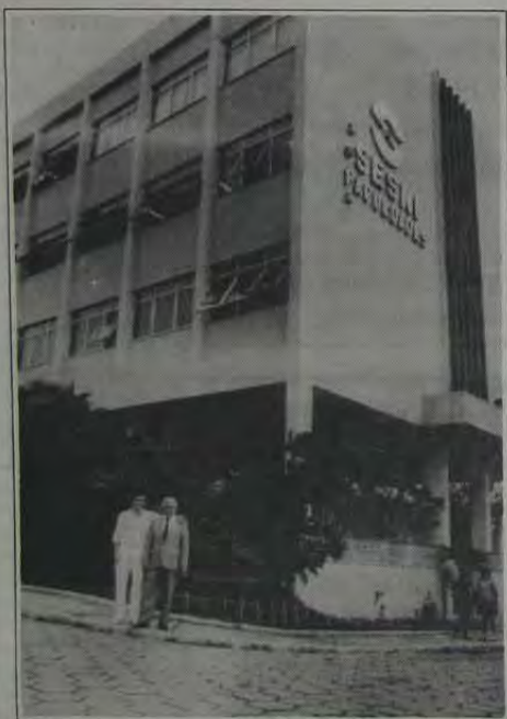
Sede da Universidade em Nova Iguaçu

na época em que se comemora o nascimento de Cristo, reassume seus compromissos com a comunidade da Baixada Fluminense, desejando a todos os seus alunos, funcionários e amigos um Feliz Natal e próspero