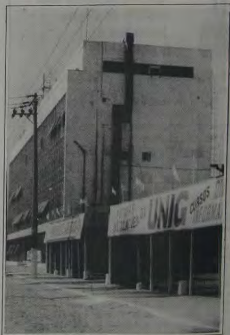
Fachadas das instalações da UNIG em São João de Meriti

Chancelaria e Reitoria da Universidade de Nova Iguaçu