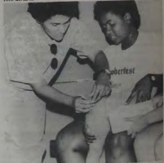
A campanha de vacinação tríplice viral se estenderá até o dia 30 de novembro

Todas as crianças na faixa etária dos 12 meses aos 11 anos devem ser vacinadas com a vacina Tríplice Viral em todo o Estado do Rio de Janeiro. A vacina que combate a rubéola, o sarampo e a caxumba está disponível em todos os postos de Saúde do município.