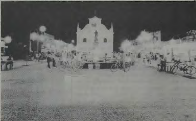
As reformas operadas na praça e no calçadão deram um novo visual ao centro de Queimados, cuja população conta agora com um agradável ponto de encontro.

Um novo espaço para o lazer. Assim está sendo conhecido o calçadão e a Praça Nossa Senhora da Conceição - em Queimados - depois que foi reinaugurada no início do ano. A população do município de Queimados agora conta com um local limpo e agradável para permanecer nas horas de lazer, ou quando está fazendo compras na cidade ou para o bate-papo e chope depois do trabalho.