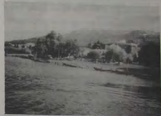
Toñino, na divisa de Portugal e Espanha