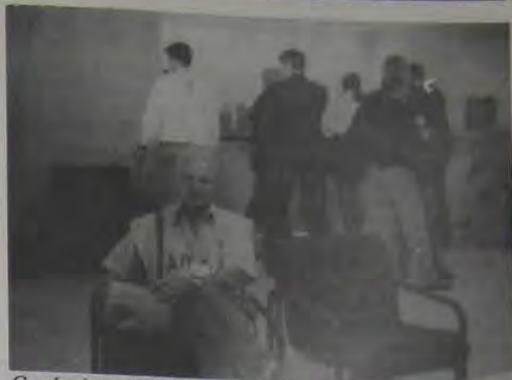
O colunista, na Sala Vip do Palácio de Cristal, na cidade do Porto, Portugal.