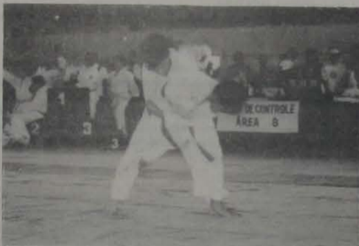
No tatame, 674 atletas mostraram porque o judô da Baixada é um dos melhores do Estado.