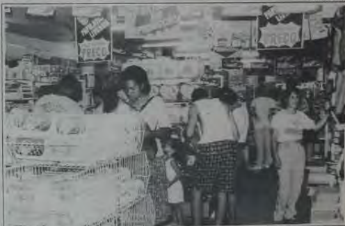
Nas casas especializadas no ramo de papelaria-livraria já é grande a procura de pessoas interessadas na compra de material escolar