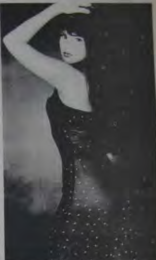
Sevana dá um plê na temporada de sol e veste transparentes, só para arripiar.