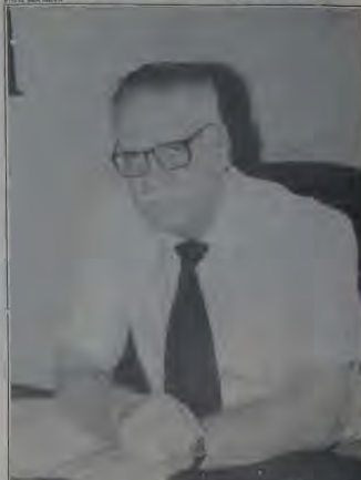
A suspensão, segundo Odilardo, de todo o concurso não pode ser considerada uma responsabilidade da OAB, entidade que ajudou o seu embargo somente para as provas de habilitação para o cargo de procurador.

O prefeito deve ter refletido melhor sobre o assunto, e diante da volta dos funcionários, chegou a conclusão que o concurso provocaria um excesso de pessoal -, concluiu.