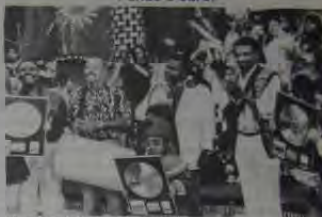
Grupo Fundo de Quintal no Xuxa Hits

O grupo Fundo de Quintal recebeu no programa Xuxa Hits, o Disco de Ouro - referência a vendagem superior a 100 mil cópias, por seu 12º álbum "Carta Musicada". O programa foi ao ar no último dia 23 de julho. E ainda teve mais! Grande festa no Asa Branca com direito a show e a presença de vários nomes do mundo do samba, também em comemoração ao Disco de Ouro.