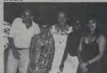
Com a equipe da Sweet Way