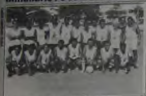
Não foto, os atletas da Rola Cansada FC