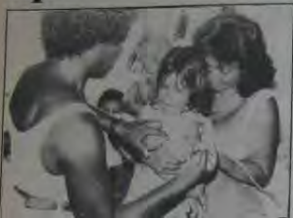
Grande número de crianças tem obrigatório seu nome, há um mês em crianças a chegar antes das 6 horas da manhã no Posto de Saúde Vasco Barcelos, em companhia de suas mães.

Com o aumento da tuberculose no Estado, a Secretaria Estadual de Saúde determinou a todos os municípios a realizarem a dose de reforço da vacina BCG. No Centro de Saúde Vasco Barcelos, em Nova Iguaçu, onde são distribuídos apenas 60 senhas, a maioria dos pacientes é obrigada a chegar ao local antes das seis da manhã. Por falta de pessoal para aplicar a dose, as crianças ficam até quase às 10 horas esperando receber a vacina.