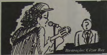
Ilustração: César Ray

Estaria tudo normal naquela noite, não fosse a presença daquele homem de terno em frente ao palco. Olhos fixos no cantor. Todo e qualquer movimento era observado com minúcia pelo tal homem engravatado.