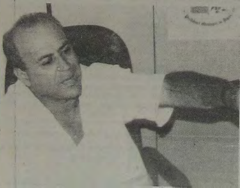
Carlos Moraes Costa PREFEITO DE JAPERI