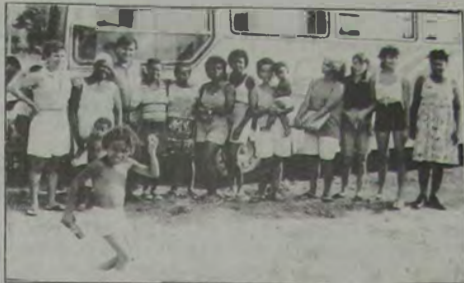
As creches municipais serão ampliadas e, na medida do possível, novas unidades serão instaladas