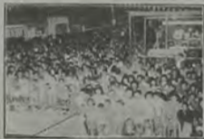
A festa de Santo Antônio, este ano realizada na Av. Araguaia, contou com expressiva participação popular

O Prefeito Altamir Gomes, de Nova Iguaçu, pretende intensificar os trabalhos de todos os setores da administração municipal, estabelecendo metas a serem atingidas no próximo ano, que superem os números alcançados até agora.