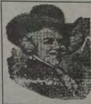
Barão de Murambá

Enganar, prometer (sabendo que não vai cumprir), sonegar, deixar de cumprir o acertado, fugir aos domínios da legislação têm, sem limites muito claros, um vasto império. A velha má-fé tem muitos aliados e vassalões fiéis. Aqueles que fogem - para não cair nas contendas da escravidão - são tidos por desligados, bobos, cafonias mas... são livres. Os que se viciam, e vivem apostando na centena 171, jamais serão libertos. Toda a verdade ocultada, mesmo sem dolo, propicia a implantação efetiva do império da mentira. A deusa impunidade ainda não perdeu seu altar.