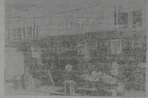
Não têm sido poucas as reclamações dirigidas a este jornal sobre o aumento abusivo de preços registrados nos supermercados da cidade. No mercadinho Príncipe (foto), localizado na Rua Bernardino de Mello, as queixas se referem, sobretudo, à elevação dos preços do pó de café, arroz, feijão e, de modo mais intenso, dos materiais de limpeza.

putado estadual pelo PT, estará realizando hoje, sábado, no Esporte Clube Iguaçu. O baile-show vai reunir as pessoas que estão em sua campanha e nas campanhas de deputados federais do Partido dos Trabalhadores. Jorge Bitar, candidato a Governador, e Benedita e Saturnino, candidatos ao Senado pela Frente Brasil Popular, também estarão presentes. Além de diversos artistas locais, a festa será animada pelos conjuntos Taça de Cristal, Diamante Negro e Itapoá. A entrada é franca. Maiores informações pelo tel. 796-3385.