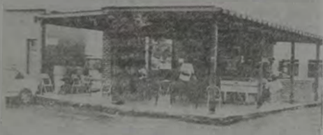
Na lanchonete, junto à piscina, os associados do América se reúnem para bater um bom papo e tomar a sua cervejinha

As camisetas autografadas podem ser adquiridas em qualquer órgão da LBV. As músicas, bem como os cliques já estão incluídos na programação de diversos programas de rádio e televisão.