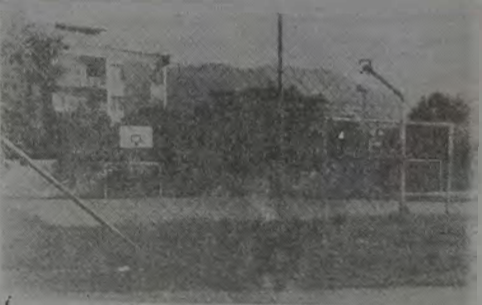
Na quadra polivalente, a rapaziada aproveita sempre as manhãs de sábado e domingo para disputar torneios de "pelada"