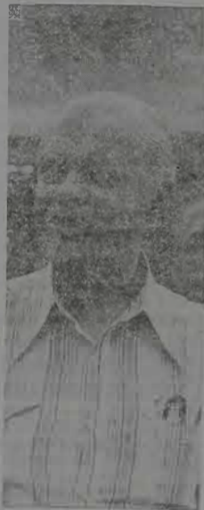
em Queimados. Nelson Carneiro também tem dado total apoio aos projetos municipais nas áreas de educação e saúde — setores prioritários no plano de governo do prefeito Jorge Pereira.

Em razão dos seus inúmeros compromissos, Nelson Carneiro lamentou, na ocasião, não ter tido tempo para visitar toda a cidade, prometendo retornar em breve. Depois das máquinas para a dragagem dos rios, o Senador também deu total apoio aos projetos municipais nas áreas de educação e saúde — setores prioritários no plano de governo do prefeito Jorge Pereira.