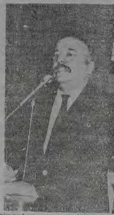
Aluísio Gama, prefeito de Nova Iguaçu, durante o anúncio das reformas das escolas.