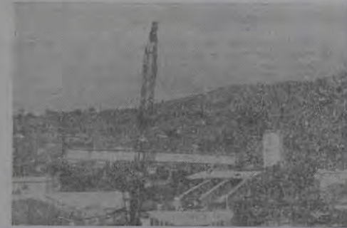
A rampa do Viaduto sobre a Av. Getúlio Moura, cairá na área próxima ao Parque 4.º Centenário, nas imediações da Praça Santos Dumont