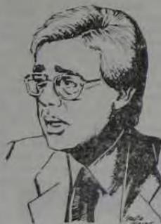
Moreira diz que garante a instalação do Pólo através da Justiça

O Governador do Estado disse ainda que o Ministro Roberto Cardoso Alves é um