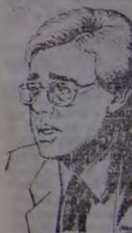
Moreira Franco promete investimentos industriais

Atualmente, há sete empresas já operando no Distrito Industrial de Duque de Caxias e outras 39 em negociação ou implantação em Nova Iguaçu. Há outras 12 empresas em plena operação e outras 12 estão sendo planejadas, totalizando 70 empresas em funcionamento. O total de empregos gerados pelas indústrias já implantadas é de 5 mil empregos e 4.800 em N. Iguaçu.