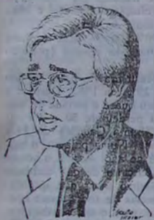
Moreira Franco promete incrementar distritos industriais

Atualmente, há sete empresas já operando no Distrito Industrial de Duque de Caxias e outras 39 em negociação ou implantação; em Nova Iguaçu há oito empresas em plena operação e outras 12 estão tratando de sua participação. O total de empregos gerados pelas indústrias já implantadas é de 5 mil em Caxias e 4.800 em N. Iguaçu.