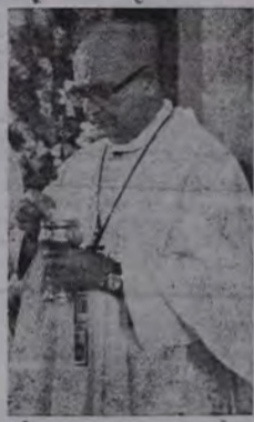
meçará às 14h30m e contará com a presença de bispo de Nova Iguaçu, Dom Adriano Hipólito (foto), e de dezenas de padres e religiosos.

O fato chegou a opinião pública do Estado por terem sido vítimas pessoas que estavam divertindo-se numa festa, quando chegou um grupo de marginais. Além de roubar, o grupo fez questão de cometer outros tipos de violências, inclusive com mulheres. A Celebração co-