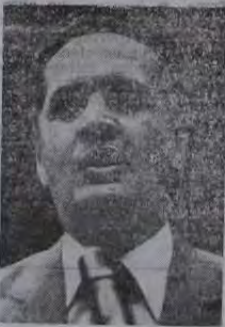
Oswaldo Lima, ex-deputado federal, é responsabilizado entre outros, pelo descrédito das lideranças políticas de Belford Roxo