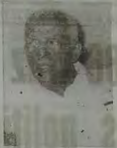
(MISSA DE 1 MÊS)