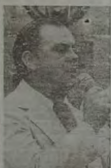
Ruy de Queiroz

O dinheiro público será amplamente utilizado nas campanhas políticas, como aliás ocorreu no ano passado, sem que ninguém pudesse impedir. O máximo conseguido foi a abertura de um processo junto ao Legislativo, que não deu em nada. Dessa vez a cartada será definitiva. O problema é que nem todos terão condições de galgar qualquer benefício para suas campanhas. Os vereadores estão atrás de asfalto, manilhas, luminárias e outras obras para tentarem a reeleição. O povo, por sua vez, quer muito mais do que o Governo pretende fazer demagogicamente.